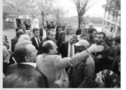
pe Cemevi'ni başta Gülsuyu olmak üzere Maltepe halkı yönetmektedir.

Aynı akşam Cemevi'nde yapılan halk toplantısında mahalle halkı, yapmış olduğu tartışmalar sonucunda; Maltepe Cemevi'ni, İzzettin Doğan Vakfı'ndan çıkararak halkın yöneteceği bir dernek kurulması kararı alındı. Ayrıca İzzettin Doğan'ın "Cem Vakfı" tabelasının da götürülüp İzzettin Doğan'a teslim edilmesine karar verildi. Gerçekleştirilen direniş sonucu Malte-