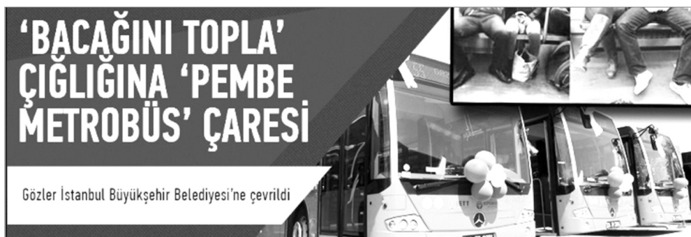
Gözler İstanbul Büyükşehir Belediyesi'ne çevrildi

Geçtiğimiz yıl, Gezi Parkı direnişiyle başlayan ve Gezi İsyanı olarak tüm kentleri saran dalga içindeki varlık biçimimize dair tartışmalar yaptık, olumluluk ve olumsuzluklarımız üzerine durduk. Bu değerlendirmelerin en temeli, Gezi İsyanı boyunca tek tek örnekler dışında YDK kimliğimizle isyanın bileşeni olamamak üzerinedi. Bu anlamıyla 1 Mayıs'la birlikte hazırlıklarımızı bu yönüyle yapmak ve eksiklerimizi tamamlamakla karşı karşıyayız. Aksi takdirde bir yandan sürecin içinde yer alırken diğer yandan kadın kitleleriyle etkileşime giremeyen, emekçi kadınların taleplerini ve sesini alanlara taşıyamayan, örgütlenmemizi iletmemekten uzak bir tutum sergilemiş oluruz ki, bu da sürecin nicel gücünden öteye gidememek, niteliğimizi yansıtamamak ve yüzeyi zorlayan öfkenin sahiplerine yabancılaşmak anlamına gelecektir.