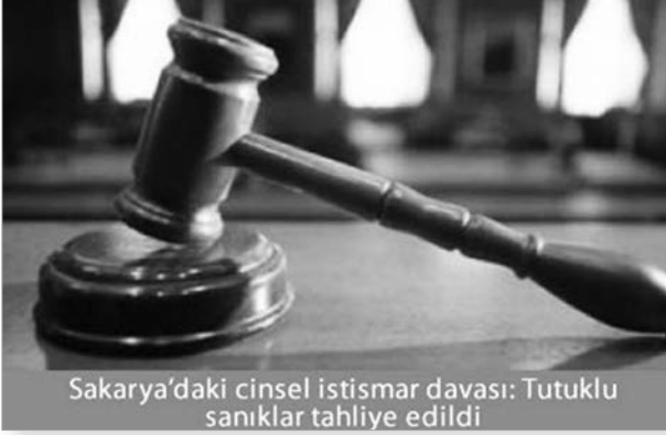
Sakarya'daki cinsel istismar davası: Tutuklu sanıklar tahliye edildi

BDP binalarına saldırdı. HPG tarafından üstlenmemesine rağmen devletin bu katliamı ulusal harekete yıkma çabası, uzun süre gündemde tutularak birçok bölgede Kürt halkına yönelik fiili saldırıya dönüştürüldü.