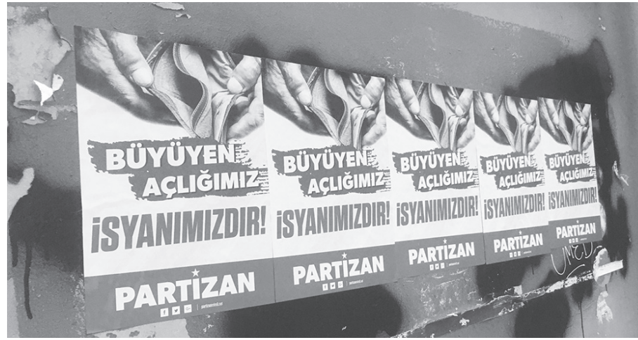
Sarıgazi ve Kartal bölgelerinde sticker, afiş çalışması, bildiri ve Yeni

Ajitasyon/propaganda araçlarını yaygın bir şekilde kullanmayı hedeflediklerini ifade eden Partizan okurları, Dersim'in merkez mahalleleri, Bursa'nın Gürsu ve Nilüfer ilçeleri ile İstanbul'un