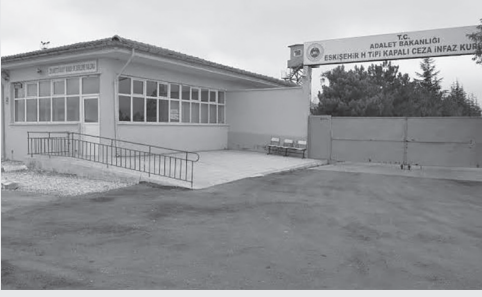
HABER MERKEZİ- Eskişehir H Tipi Kapalı Hapishanesi'nde

olan tutsakların koğuşlarına yapılan baskınlara özel hareket polislerinin katıldığı belirtildi.