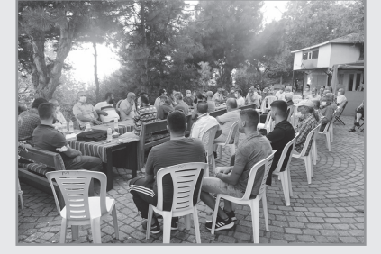
Gülensu Gülsuyu Güzelleştirme Derneği'nden halk toplantısı

diği çalışmalarda, devletin bölgede kadınlara yönelik hayata geçirdiği taciz tecavüz, şiddet ve katletme politikasına karşı örgütlü kadın mücadelesinin büyütülmesi gerekliliği vurgulandı. Yapılan çalışmalarda kadınlar, "ne kadar ses çıkarıp örgütlü hareket edersek bugün bu politikaları uygulayanların karşısında daha güçlü dururuz" diyerek somut örneklerle mücadelenin örgütlü yürütülmesini vurguladılar.