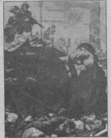
Barikattaki son kadın nefes, idam mangasına gülen genç kız, Komün'ün onlara kısa bir süre de olsa verdiği özgürlük için ölüyordu.

"Petrolcüler", Komün'ün yenilmesi sırasında, yenik yaşamaktansa yiğitçe vuruşup ölümü göğüslemeyi yeğlemişlerdi.