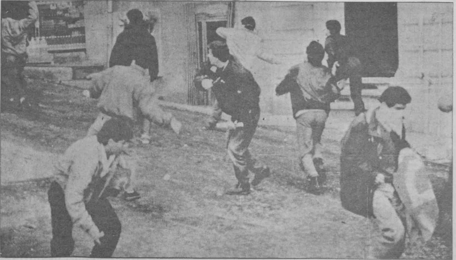
1 Mayıs İşçi Sınıfının Birlik Dayanışma ve Mücadele Gününde, 1990'da İstanbul'da Şişhane-Tarlabası yoluyla Taksim Meydanı'na çıkmak isteyen devrimcileri polis saldırarak engelledi. Ancak "göstericiler 1 Mayıs alanına çıkmakta kararlıydılar. Bu nedenle polisle çatışma çıktı.

kal mücadelenin buralarda hangi temelde ve nasıl ifadelendirileceği sorunudur. Bu sorun boyutlu bir tartışmayı gerektirmekle birlikte aynı zamanda konumuzu dağıtacağından bir belirlemede bulunup geçiyoruz; o da bu sorunda proletarya partisinin çizgisi berraktır. Sorun bu çizginin pratiğe geçirilmesinde yatmaktadır. Radikal mücadeleyi savunan küçük burjuva akımlar açısından ise çizgi sorununda yatmaktadır. Bu sorun hemen hergün yanlışlığını ispatlamaktadır.