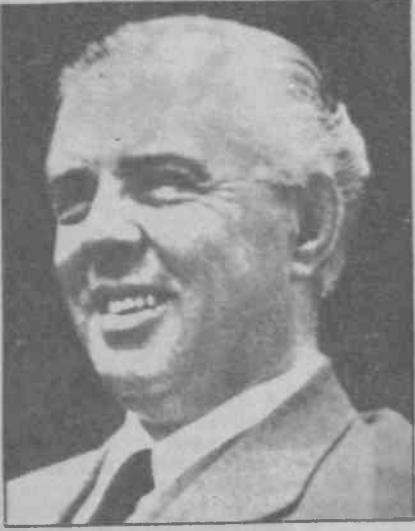
Enver Hoca, AEP'in lideriydi.