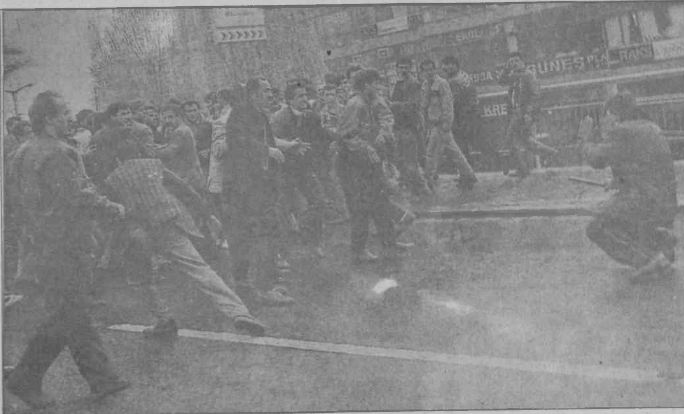
Polis kurşunlarına karşı taşla sopayla savaşmasını bilen bir halk nihai hesaplaşmada zaferle çıkmasını bilecektir.

Şehirlerde ise düşman çok daha az çabayla çok daha az muharebe kazanarak bunun üzerinde psikolojik üstünlük sağlamayı becerabiliyor. Burada bir gelişkin olduğu söylenebilir. Ancak bunun yanıtı "orada silahlı mücadele var, bundan dolayıdır" demekle verilmaz. Diğer taraftan bu yanıt silahlı mücadeleye önem verir gibi görünse de aslında mücadelenin diyalektiğini kavramayan bir anlayıştır. Yani böyle bir yanıt şehirlere barışçıl mücadeleyi kefen biçme hatasına götürür. Yine de böyle bir yanıt bir sıkıntıya işaret etmektedir. Bu sıkıntı silahlı mücadelenin şehirlerde olması gerektiği noktada olmalıdır. Şehirlere barışçıl mücadele önerilmeyeceğine göre, radi-