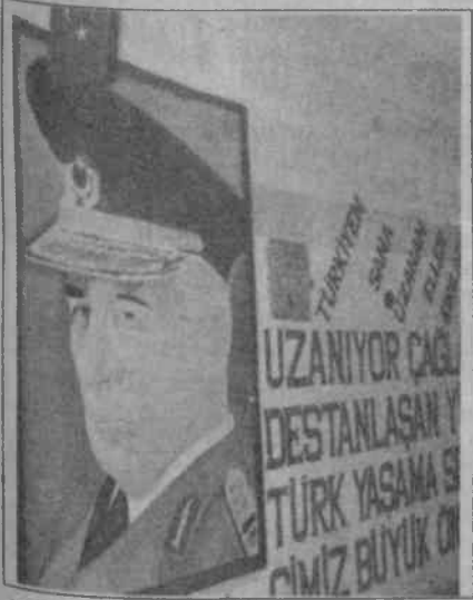
Diyarbakır Cezaevi duvarlarında Kenan Evren resmi ve "Türk" kelimesi eksik olmuyor.

Açıklamada; tüm yurtsever, devrimci, demokrat kamu-oyu, demokratik kurum ve kuruluşlar, kendi-ne insanım diyen herkese, Diyarbakır zin-danlarında gerçekleştirilen katliama karşı seslerini yükseltme ve pratikte tavır alma çağrısında bulunuldu.