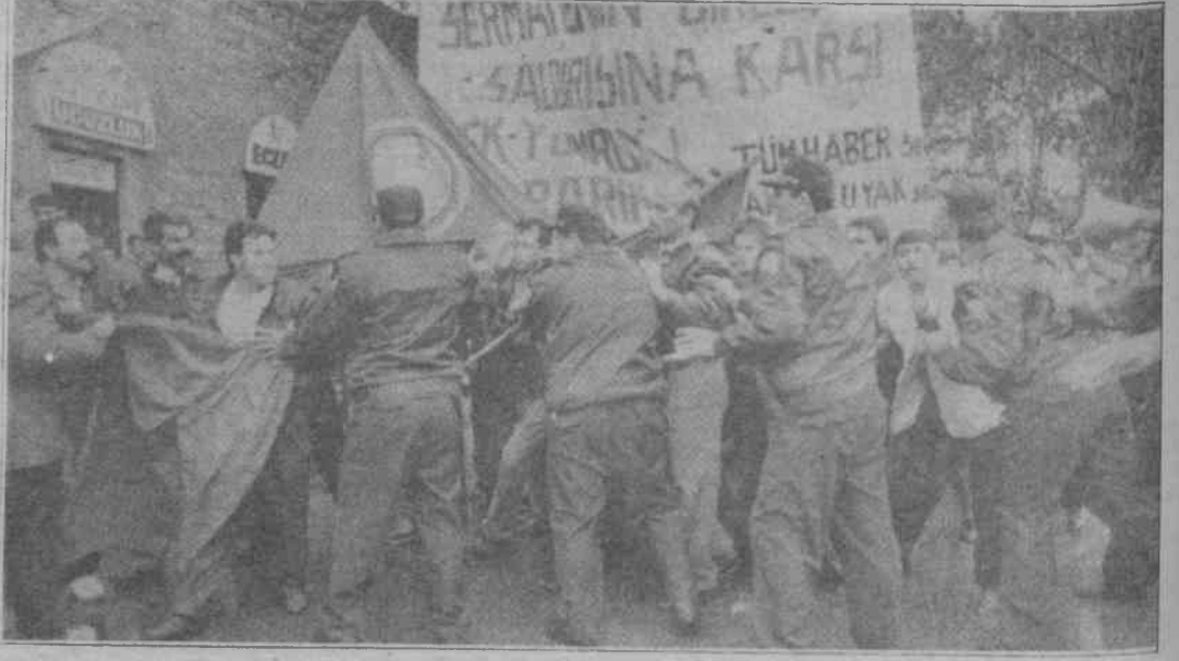
Kamu emekçileri bir kez daha polislerin saldırısına uğradı

Demokrasi Meydanı'nda yapılan basın açıklamasında özelleştirme, insan hakları ihlalleri, anti-demokratik uygulamalar, Kürt sorununa askeri çözüme karşı çıkılacağı, yeni baskı yasalarıyla, tüm emekçiler aleyhinde sürdürülen sosyal ve siyasal koşullara karşı mücadele edileceği belirtildi. "Hükümet istifa", "Yaşasın Halkların Kardeşliği!" gibi sloganlar atıldıktan sonra kitle dağılmaya başladı. Dağılmakta olan kamu emekçilerine polis saldırarak 5 kişiyi gözaltına aldı. Gözaltına alınanlar Üsküdar Emniyet Müdürlüğü'nden savcılığa sevk edildikten sonra akşam