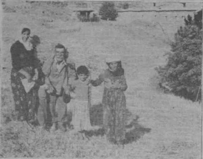
Dersim köylüsü için sarıbaşaklar geçmişte kaldı. Bugün toprakta külden başka birşey yok.

Bölgeyi insansızlaştırma politikasıyla hareket eden devlet, bu planını 1980'li yılların ortalarında yavaş yavaş hayata geçirmeye başladı. İşte bu plan dahilindeki birkaç örnek.