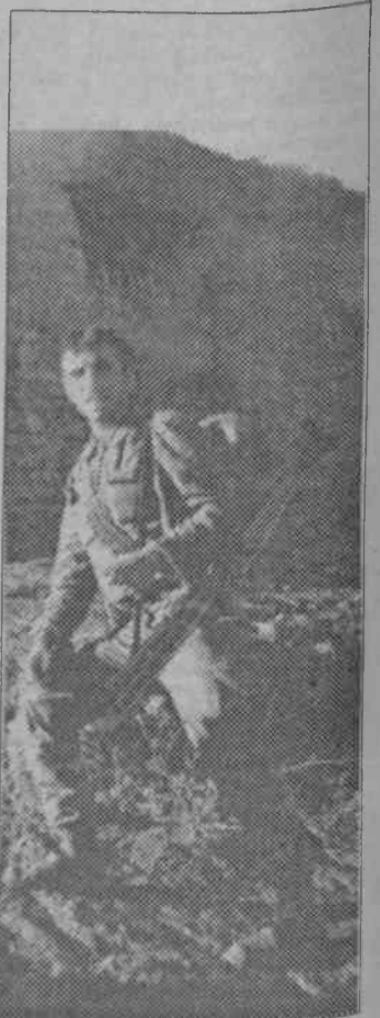
İşte Dersim köylerini ateşe veren askerlerden biri

Öte yandan, TC güçlerinin, Bingöl'ün Kiği ilçesine de göç ettirme ve yakma operasyonları düzenlendiği öğrenildi. Buraya yapılan operasyonlarda 25 köy boşaltıldı ve çok sayıda köy yakıldı. Yakılan köylerin isimleri şöyle: Hapaskomları, Aşağı Gajık, Ungüzük, Çanakçı, Abvank, Çomak, Hurs, Arık, Avirtinik, Tırıkan, Suvarıç, Cibirköy, Hocatur, Kijikan, Harur, Molla İbrahim, Halveli-