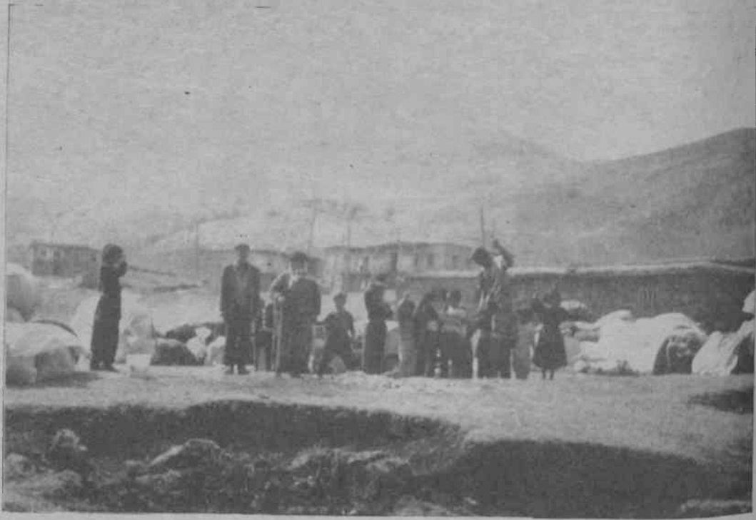
Yarın ne olacağı belirsiz çocuklar gülerken zafer işareti yapıyor

Mazgirt köylerinden, evi yakılan bir köylü şunları anlatıyor: