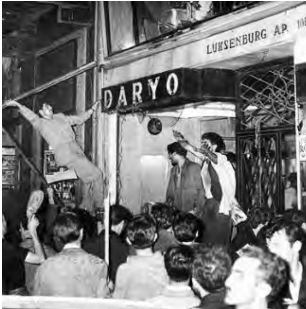
6-7 Eylül Olayları- İstiklal Caddesi

Günümüzde yapılan katliamların karakteristik özelliği; Osmanlı'nın, Türkleştirme projesiyle beraber vücut bulmuştur. Ülkede yapılan katliamların bir çoğunu, halk kitlesi gözünde meşrulaştırmak için Türk hakim sınıfları