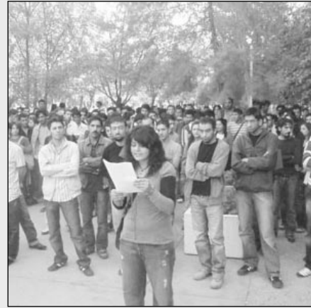
18-20 Ekim günleri Özel Harekat Timlerinin yaptıkları ev baskınları sonucu

ve öğrencilere yönelik polis baskısı uygulanmakta.