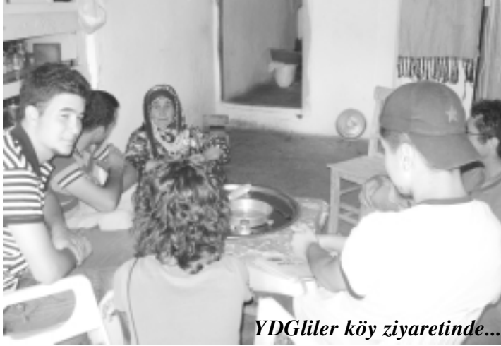
YDG'iler köy ziyaretinde...

Ertesi gün merkeze döndüğümüzde genel bir toplantı aldık. 2-3 saat boş zamanımız vardı. Sıra eğlenmedeydi. Şortlarımızı alıp hemen Munzur'a gittik. Hevesli bir şekilde gittik ama birkaç kişi suya giremedi. Girenler de suda en fazla iki dakika durabildi. Ben de suya büyük bir hevesle girdim ama çok duramadım. 4-5 saniye suda durduktan sonra bedenim uyuşmaya başlıyordu. Öğlen sıcakta, buz gibi Munzur'a girmek ayrı bir zevkti.