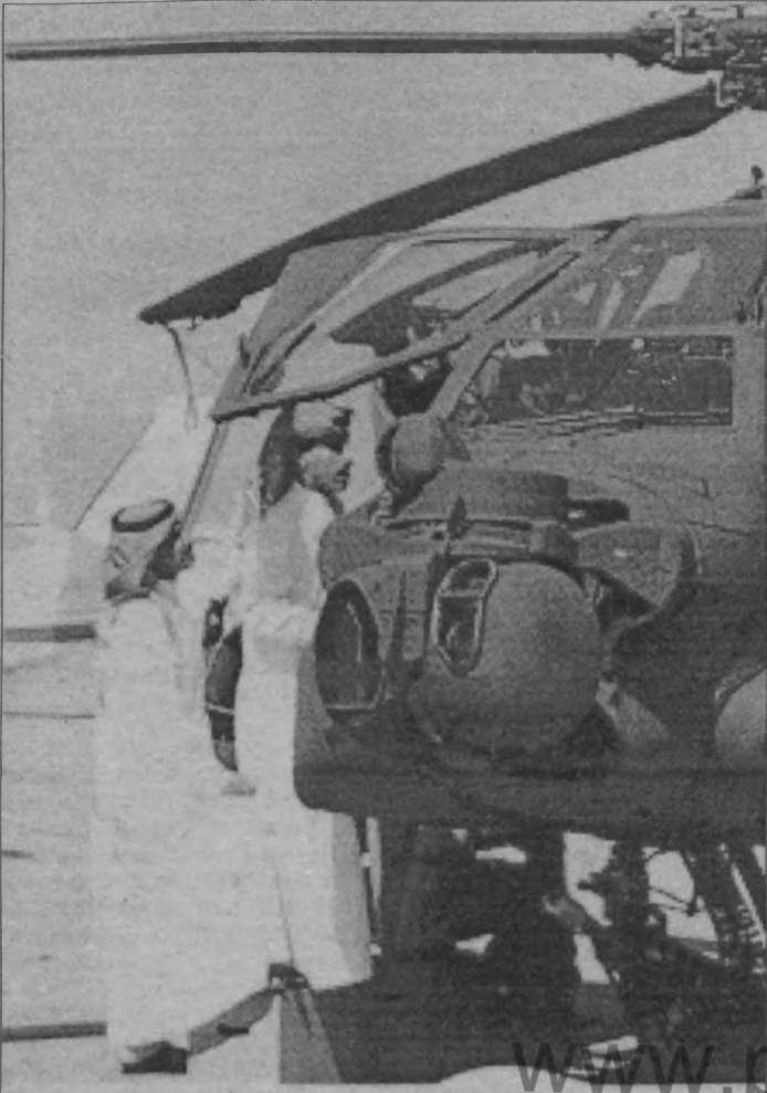
Birleşik Arap Emirlikleri'nin Dubai kenti. Alıcılar 25 milyon dolarlık Apache helikopterine bakıyorlar.