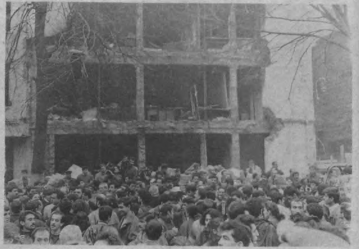
Bombalanan Özgür Ülke'nin yıkıntıları arasında yükselen devrimci dayanışma, Özgür Ülke'yi yaşıyor. Ya bombala emrini verenler... battıkça batıyor.

"Özgür Ülke'nin her sayısının toplatıldığı, dağıtımı devlet gücünce engellendiği, 35 çalışana halen tutuklu bulunduğu halde, bu