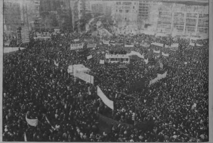
20 Aralık'ta onbinlerce kamu çalışanları ve herkesimden emekçiler, Ankara meydanlarında sloganlarıyla inlettiler.

Bugün çalışanlar için genel grevin objektif koşulları vardır. Ama çalışanlar açısından, bunun nesnel zemini yaratılmamıştır. Herkes, toplumun her kesimi ayakta, ama, bir kurtuluş ışığı görmüyorlar. Emekçilerin örgütlenmesi yaratıldığı durumda, genel grevin koşulları mevcuttur. Genel grevin koşullarının olmasına rağmen, emekçilerin örgütlülük düzeyinin buna hazır olduğunu söyleyemiyoruz, erkendir. Ama, 1995 yılı çok kavgalı geçecek. Kamu çalışanları tüm eksikliklerini gözden geçirerek örgütlülüğünü yaratma noktasında emekçilerin birlikte mücadelesinin zemini yaratacaktır.