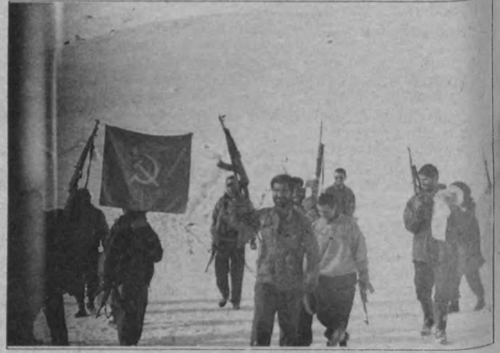
Gücünü halktan alan halk savaşçıları haklı olmanın getirdiği güçle dimdik ayakta ...gelişiyor...güçleniyor.

Egemen sınıfların uşak basın kuruluşlarının da şakşakladığı "bü-