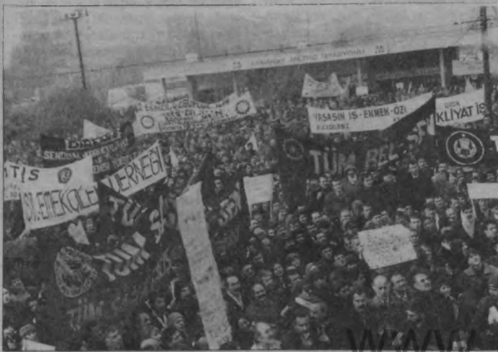
Onbinlerce emekçi ellerinde pankartları dillerinde sloganlarıyla geldiler. Aksaray Meydanını bayram gününe çevirdiler.

Saat 12.00'ye doğru emekçiler Altıyol'a geldiğinde bir grup memur ters istikamette Kadıköy Belediyesi'ne doğru akın akın yürüyordu. Halkın eyleme ilgisi oldukça yoğundu. Sık sık geçen kortejleri alkışlıyor, onları seyrediyor hatta aralarına katılıyorlardı. En öndekiler Kadıköy Meydanı'nı doldurmuş, meydana Altıyol'a bakıldığında ise kortejin sonu dahi görünmüyordu. 20 bin emekçi ve işçi akan seller misali alanları doldurmuş, hatta alanlarda taşmıştı. Kadıköy, Kadıköy olalı belki de ilk kez böyle bir eyleme tanık olmuştu. Saat 14.00'ye doğru KÇSP'nin basın açıklaması okundu. DİSK'ten Genel Uygur ve sanatçı İlyas Salman bir konuşma yaptı. İlyas Salman