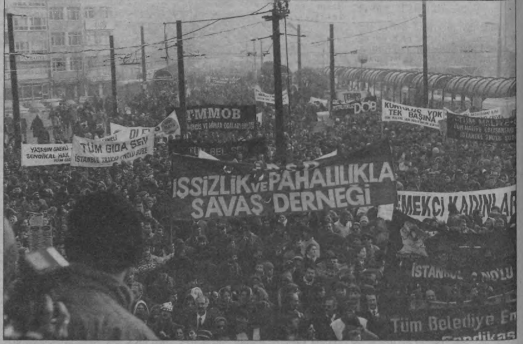
Eğemenlerin her türlü tehditine rağmen, yüzbinlerce memur iş bıraktı, onbinlercesi de alana çıkarak tehditlere meydan okudu.

Hakim sınıfların tehditi sökmeydi. 100 binleri aşan katılım karşısında hakim sınıflar geri adım atmak zorunda kaldılar. Tabii, tükürüklerini yalamadıklarını kanıtlayabilmek için memurlar hakkında idari soruşturma başlattı. Ayrıca Malatya Valisi'ne kararını "Bedük Cumhuriyeti"ne çıkartan, tüm gerici kurumlaşmayı yaratan, devrimci-demokratik tüm oluşum ve etkinliklerin düşmanı, şimdinin Kayseri Valisi Saffet Arıkan Bedük, "azizliğini" burada da göstererek