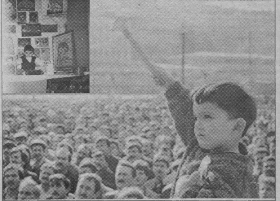
Örse çekiç arasında yoğulduk, çelikleştik biz. Şu bilinsin ki, geleceğimizi MLM4nin yol göstericiliğinde çelik disiplin ve irademizle mutlaka özgürleştireceğiz.

lının hatalarını, eksiklerini ve olumsuzluklarını kendi bulunduğumuz organ ve alandan başlayarak, dalgalar şeklinde açılarak bütüne ulaşmaya çalışmalıyız. Bulduğumuz alanlar başlayarak yapacağımız tespitler, nedenleri ve niçinleriyle tahlil edildiğinde, çözümün yolu ve yarısı bulunmuş olacaktır. '95 yılında aynı eksikleri ve hataları tekrarlamak tarafılsa değilsek, geçmişteki yanlışlarımızdan, yenilgilerimizden öğrenmesini bilmeliyiz. Ancak bu deney ve tecrübelerle her yeni süreç bir önceki süreci aşabilir, bir üst boyutta devrimci'ce yaşanabilir. '94'ün (geçmişin) muhasebesini yapmayan veya yapamayanlar, '95'i (geleceği) ileriyeye taşıma şanslarını ta işin başında kaybetmişlerdir. Onlar eğer tesadüfler olmazsa, en fazla geçmiş bir daha tekrarlamakla yetineceklerdir. Bunun içindir ki geçmişimizdeki olumluluk ve olumsuzluklarımızdan öğrendiklerimiz, geleceğe klavuz yapılmalıdır.