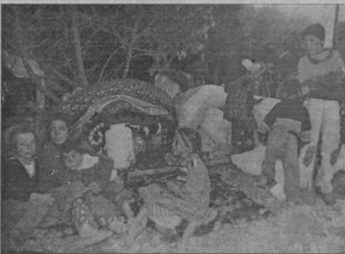
Dersim halkına yine göç, yine aci, yine gözyaşı ve ölüm.

Dersimin kış soğunun dayanılmazlığını bilmem bilirmisiniz? Bizleri kar üstünde açılmış çadırlara koydular. İki gün hiçbir şey verilmedi. Ancak işkence tüm hızıyla sürüyordu. Sıra dayandıktan tutun da falakaya kadar her türlü iğrençlik yapılmaktaydı. Bu soğukta aramızda uyuyanlar oluyordu. Donmaması için yurak tutulmaya çalıştık. Fakat yaklaşıp bes kişinin ayakları dondu. Birçoğu farklı bir şekilde hastalandı. Bir köy-