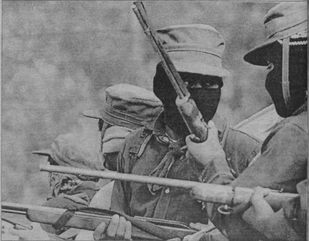
19 Aralık günü, çevreyi kuşatan ordu birliklerinin arkasına sessizce sızan binlerce gerilla, sabaha dek yürüdü ve 38 kasabayı işgal etti.

Tabii, Chiapash devlet yetkilileri de dikkatliydi. Bölgedeki 8 anayasa, Zapatistaların barikatlar kurdu-