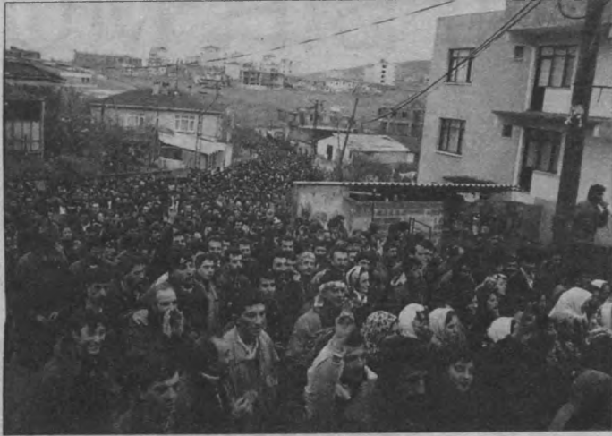
Tuzla Organize Deri Sanayii işçileri edinmiş olduğu sınıf perspektifiyle, Türkiye işçi sınıfına direnişi ve kazanımı gösteriyor.

Bilindiği gibi Cihangir Deri fabrikasında sendikal mücadele veren işçiler, işveren Ergun Cihangir'in işyerinde sendikayı kabul etmemesi üzerine 3 aralıkta direnişe geçmişti. Tuzla Organize Deri Sanayii'nde direnişteki işçileri desteklemek için yapılan eylemlerden ilki 5 aralık'ta kitlesel yapılan basın açıklaması. Yine işverene karşı 8 aralıkta yapılan uyarı eylemiydi. Uyarı eylemi ve diğer protesto eylemlerinde vurgulanan "Tuzla Organize Deri Sanayii'nde sendikasız bir işyeri kalmayacak" hedefi, bir çok zorluğu göğüslemeyi getiriyordu. Bu bilinçle eyleme başlayan, eyleme geçen işçiler, sendikal haklarını uzun süren mücadeleler sonucu ancak kazanabileceğinin farkında. Her türlü baskı ve provakasyona karşı ise uyanık. Karşı cephe jandarma, işverenin yanında sık sık deri işçilerini sindirme ve yok etme politikalarını yaşama geçirmeye çalışıyor. Eylem kırıcılığında komprador- burjuvazinin uşakları bir numarayı oynuyordu. 21 aralık akşamı saat 7 civarında ilk başta Tuzla Organize Deri Sanayii girişini jandarmalar tarafından tutuldu. Bir grup jandarma ve işveren uşakları direniş çadırında nöbet tutan yaklaşık 10 kişiyi ablukaya aldı. Etkisiz kalan deri işçileri, işveren uşaklarının malları dışarıya çıkarmasından sonra Tuzla, Aydınli Deri-İş sendikasına haber verir. O an sendikada temsilciler toplantısı yapıldığı için, haber aldıkları gibi doğru Deri Sanayii'ne giderler.