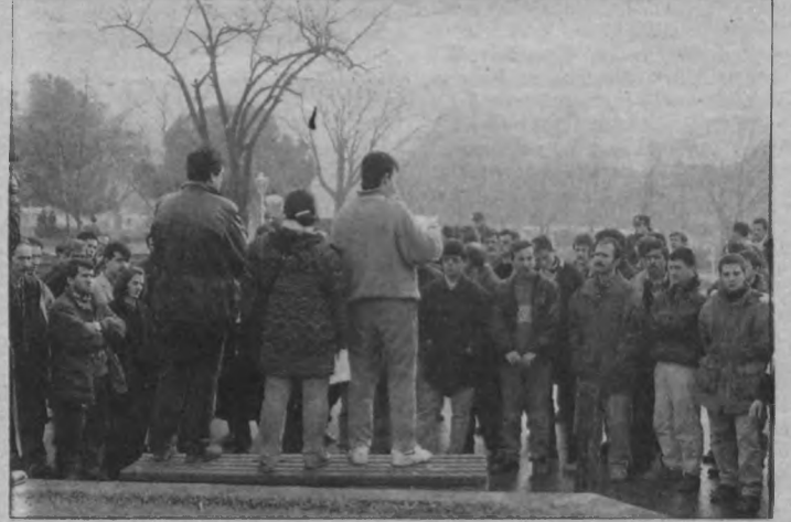
Tarihe adını Maraş Katliamı diye geçiren, yüzlerce insanın ölümüyle sonuçlanan katliam, 15. yılında çeşitli etkinliklerle protesto edildi.

EKB adına yapılan basın açıklamasında da, faşist diktatörlüğün dün Maraş, Sivas, Çorum, Elazığ, Malatya'da MIT- CIA- Kontrgerilla tarafından gerçekleştirdiği provakasyon ve katliamları bugün yine gündeme getirdiği, emekçilerin bugün olduğu yerlerde sivil faşistleri örgütlediği belirtilerek, "Devletin