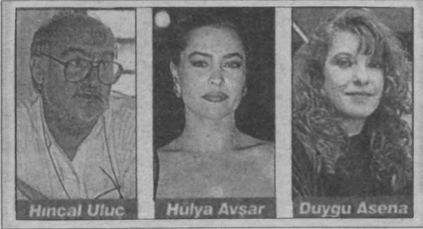
Kadın sorununu cinsellik boyutuna indirgeyip, çarpıtmalarla kendi reklamlarını yapıyorlar.

yaşadığı sorunlar karşısında alternatif olabilecek hareketler değildir. Kadın sorununun sınıfsal boyutunu görmeden, dikkate almadan ve kaynağının sınıfsal temelde olduğunu kavramadan girişilecek hareket hüsrana uğramaya mahkumdur. Erkeklere karşı mücadele, kadınların temel mücadelesi perspektifini oluşturamaz ve kadınların kurtuluşu tek başına bir kadın hareketiyle sağlanamaz.