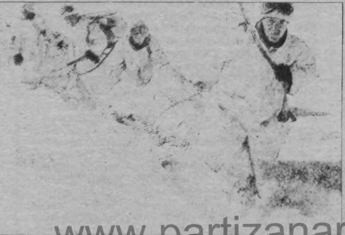
Haksız bir savaşın içerisinde sürüklenen ve ne için savaşta olduğunu bilmeyen TC askerleri, halk savaşçılarına karşı çaresiz ve yenilmeye mahkum.

dediği bu saldırı da en önemli operasyonun adına ne derlerse desinler, ne kadar sayıda asker, özel tim ve korucu katarlarsa katsınlar, onların etkinliği ve hükmü bir yere kadardır. Ve bu hüküm-fermanlar gerilla karşısında hükümsüzdür. Zira halk ordusu neferleri, direnişçi halkın "ferman padişahın, dağlar bizimdir" sözünü düstur edinmişlerdir. Ve yaşama geçir-dikleri de budur. Gerilla savaşının bimesi için halkın bitmesi gerekir, bu da mümkün değildir. Faşist komprador patron- ağa devleti de bunu yaşayarak görecektir.