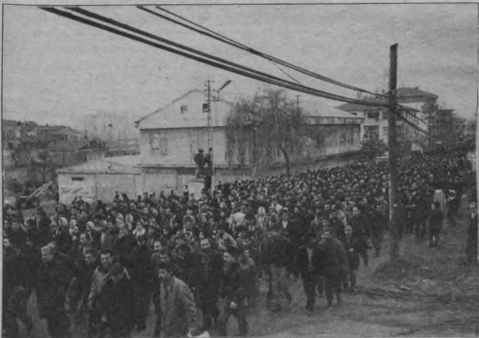
Deri işçileri işveren-jandarma saldırısını, halkla bütünleşerek, yürüyüşlerle, barikatları aşa aşa geri püskürtüyor. Direniyor... Öğreniyor... Direniyor... Öğretiyor.

Ertesi gün, 22 aralık günü Tuzla Deri Organize Sanayii'nde jandar-