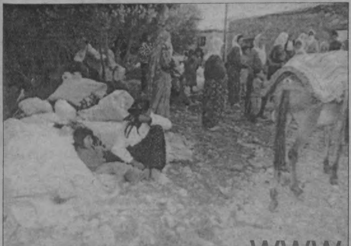
Dersim halkının köyleri yakıldı, yıkıldı göç ettirildi... Yetmedi. Şimdi de gıda ambargosuyla açlığa mahkum edilmek isteniyor.

Bölgede görev yapan jandarma ve özel tim, halka karşı her türlü baskılarını sürdürmekte kararlı olduklarını gittikleri her köyde tekrarlıyordu. Görüştüğümüz bazı köylüler, bölgede TC'nin uyguladığı baskının yeni olmadığını, 1938'lerde de yaşadıklarını ve bu tür baskı ve katliamların dünyanın hiçbir yerinde yaşanmadığını, bu baskıların amaçlarının bizleri yıldırıp göç ettirmek olduğunu, ama göç ettireceklerini ve TC güçlerinin çabalarının boşuna olduğunu belirtiyorlar.