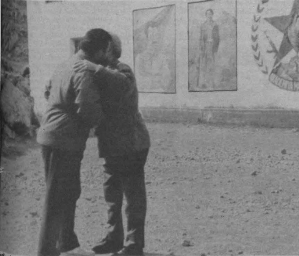
"Kürtlerin MHP'si" diye küfrettiği PKK ve önderliğini, bir dönem sonra Kürtlerin oyunu için kucaklamaya başladı. Ve bugün yine sınıfsal çıkarı gereği Kürt halkının ulusal çıkarı için küfür etmekten geri durmuyor.

yeniden üst boyuta ulaşmıştır. Dışınızda gelişen veya onaylamadığınız her hareketin arkasında provokasyon ve MİT parmağı arıyorsunuz. Dahası elinize almışsınız provokasyon ve MİT damgalı mühürü, dışınızda gelişen her toplumsal eylemi veya size yönelik her eleştiriyi hemen damgalıyorsunuz. Oysa biraz geçmişinizi sorgulasanız bu kirli silahın, bu kirli damganın en başta sizi çok derinden yaraladığını daha iyi görebilirsiniz. Gel gör ki; Aydınlikçılar olumsuzluklarını görmemekte yeminlidirler. Gerçi sınıf çıkarıdır. Ama biz yine de hatırlatalım. Ayrıca tüm bu karalama kampanyalarına ve düzen içi mücadele anlayışınıza karşı devrimcilerin ve sosyalistlerin yürüttüğü ideolojik mücadele ve siyasal teşhir kampanyasını psikolojik savaşın bir parçası olarak yorumlamanız ise tamamen bir komedidir. Deyim yerindeyse, kendiniz çalıp kendiniz oynuyorsunuz. Yazımızın akışı içinde o konuya özel olarak değineceğiz.