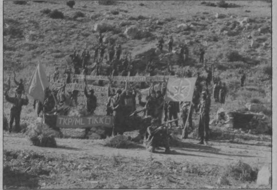
1992'de yapılan OPK ile MLM güçler birleşmişti. Ancak yapılan darbe ile devrimin önündeki tarihi fırsatlar bir kenara itildi, umutlar kırıldı.

açmamış ve P'nin iradesine-kararına başvurmamış,