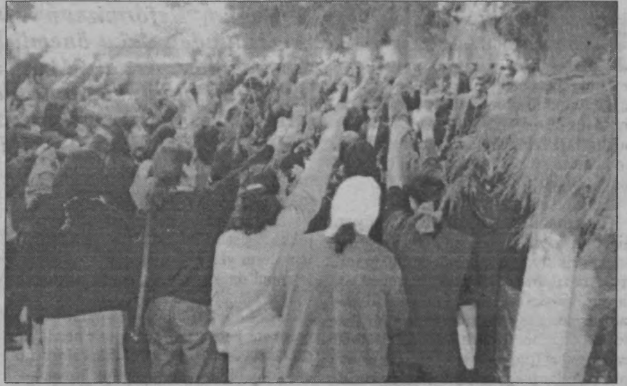
Komünist önder Halil Çakıroğlu, Mersin'de kültürel bir katılımı şanlı devrim yolundaki ölümsüzler kervanına uğurlandı.

Partimize, sınıfımıza olan inanç ve bağlılıkla, MLM biliminin ışığında and içiyoruz ki; son nefesimize kadar kanımızın