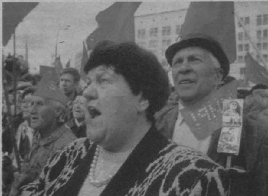
Rusya'nın başkenti Moskova'da yapılan törenlerde Lenin ve Stalin posterleri taşındı.

gençlerin de katılımı yüksek oldu ve ellerde özellikle Lenin ve Stalin'in resimleri taşındı. Sanayi devi Japonya'da kutlamalara 4 milyon kişi katıldı. Berlin'deki gösteriler çatışmalı geçti ve polise karşı kendilerini savunan göstericiler sabahlara dek taşlı barikat savaşı verdiler. Yunanistan'da Yunanistan Komünist Partisi (ML) ile Türkiye Komünist Partisi (ML) enternasyonal dayanışma ruhuyla hareket ettiler. İsveç'te yapılan gösterilerde, halk, 100 yıllık gelenekleri yıkarak sosyal demokratlardan bağımsız yürüyüşleri tercih etti. Gericiler medya tekelleri, birçok sömürge, yarı- sömürge ülkelerde gerçekleşen kutlamalara dair suskun kalarak sansür uyguladılar.