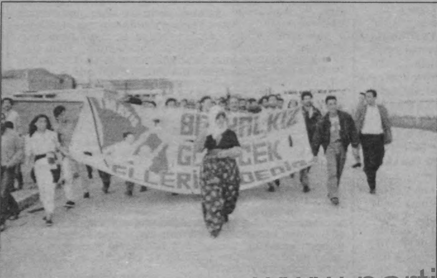
Partizan coşkusuyla geziden dönen kitle, aynı partizan coşkusıyla 5 ay öncekin direnişte olan Cihangir Deri işçilerini ziyaret etti.