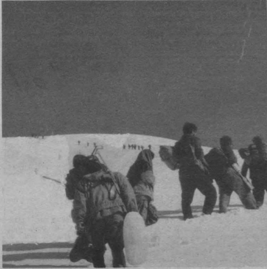
TIKKO gerillaları yerleşim yerlerini değiştirirken.

Kırın havasını soluyabilmek, ihtiyaç ve istemlerini anlayabilmek için; kır-şehir bağıntısını iyi işlemek ve merkezi olarak yerinde bir yönlendirmeyi kalıcı kılmak temel sorundur. Bu nokta doğru bir işlerlik ile yaşama kavuşturulabilirse sorunun en esashı yanı çözülmüş olur. Bu çözüm kendisine uygun gerekli örgütlemeleri de var edebildiğinde, geriye doruklara daha hızlı yürümek kalır.