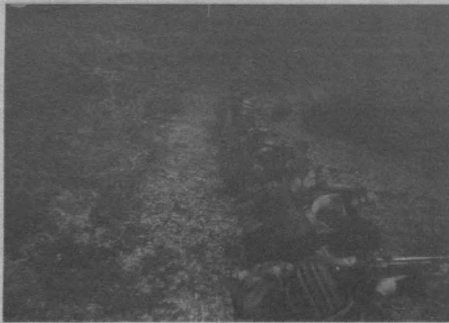
TİKKO gerillaları bir askeri eğitim sırasında

Savaşta, insan unsuru esas belirleyici öğedir. Bu her savaşta böyledir. Bu nedenle de, halk ordusunun dayanağı toplumsal katmanların daha bir özenle incelenmesi, ayrıştırılması ve her özgüllüğe uygun somut politikaların belirlenmesi bir zorunluluk gereği öncünün görevi olarak şekillenir. Bunun savsaklanması, katılım ve insan unsurunun elde tutulması, yetkin kılınması sorunlarının gözardı edilmesi, öncünün kendi esas görevi etrafındaki yoğunluğunun ve bundaki ciddiyetini verir.