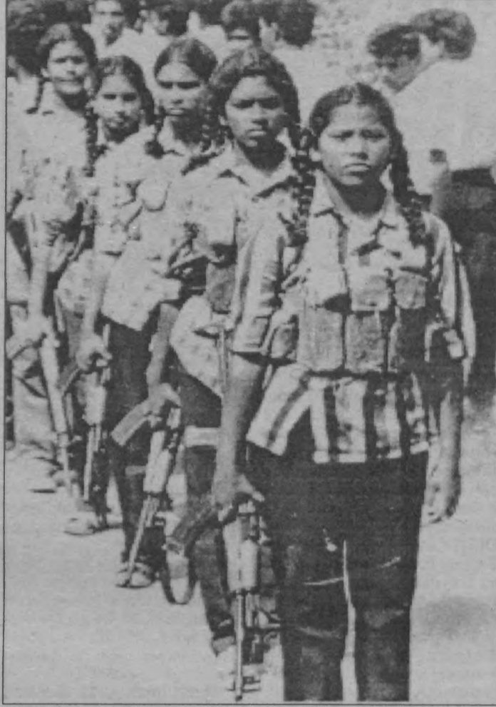
Bir Tamil gerilla birliğindeki kadın savaşçılar. Tamil Eelam Kurtuluş Kaplanları, Sri Lanka'nın kuzeyindeki jaffna bölgesini denetim altında tutuyor.

Operasyon üzerine Kaplanlar'ın büyük saldırıları da gündeme geldi. Daha ilk gün, 2 asker öldürüldü, 10'u yaralandı. Ordunun sivil halktan 10 kişiyi öldürmesi ve 74'ünü yaralaması ise bölge halkının da yoğun tepkisini çekti. Hemen ertesi-