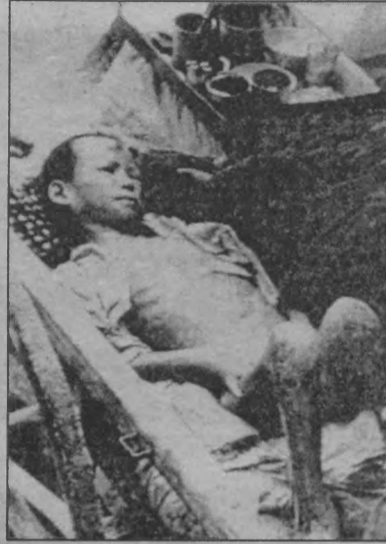
Hiroşima'da öleli Oluyor bir on yıl kadar Yedi yaşında bir kızım Büyümez ölü çocuklar

Ve Nazım Hikmet'in bir şiirini hatırlıyoruz.