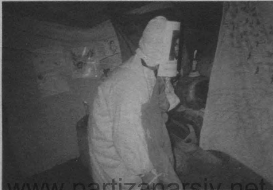
TIKKO gerillaları, Parti ve Devrim Şehitleri Anması'nda yaptıkları bir tiyatro sırasında

sinin zaman dilimlerinin vurgunluğunda süreklileştirmek, onu verimli ve istenir kılabilmek bu organların üzerinde yoğunlaşmalarını gerektiren önemli bir yandır. Savaş pratiği, aynı zamanda yenilenmenin, yetkinleşmenin, arınmanın da pratiğidir hem de en önemli ve etkili pratiğidir.