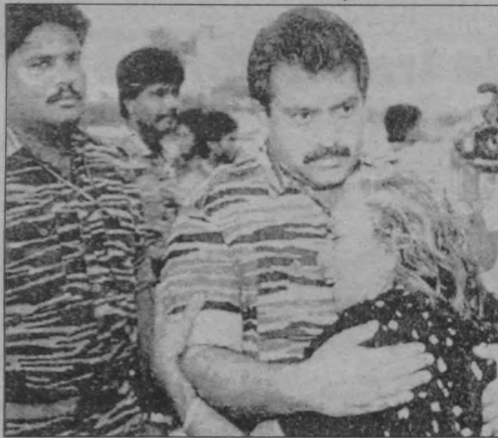
Tamil Kaplanları'nın siyasi temsilcisi, PKK tutsaklarının açlık grevini desteklemek amacıyla kurulan Pariste'ki açlık grevi çadırını ziyaret etti.

TEKK temsilcisi ise konuşmasına "Roj baş" diyerek başladı. Alanda bulunan kitleyi "devrim şehitleri ve onbinlerin iki şehidi için" iki dakikalık saygı duruşuna davet eden temsilci, Tamil-Kürt dostluğunun gelişmesinden yana olduklarını belirtti. ■