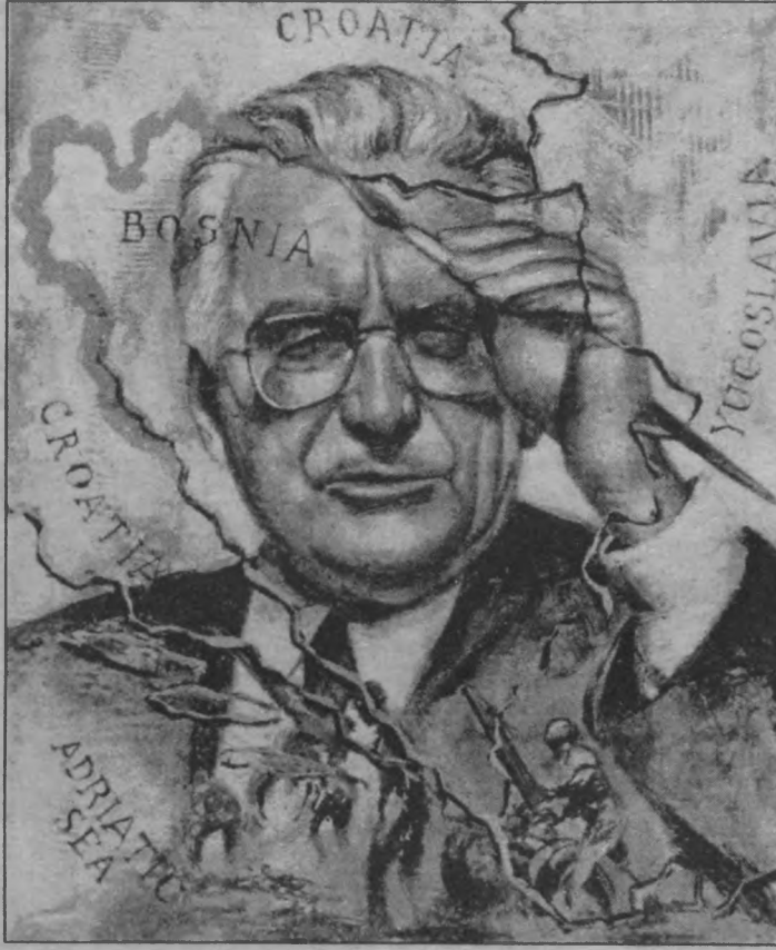
Hırvatistan Devlet Başkanı Tudjman, Sırbistan Devlet Başkanı Miloseviç ile Bosna'yı paylaşmak için "gizli" plan yaptı.

İngiltere'de yayımlanmakta olan ünlü ekonomi dergisi The Economist, olanları poker oyununa benzetiyordu. Yine İngil-