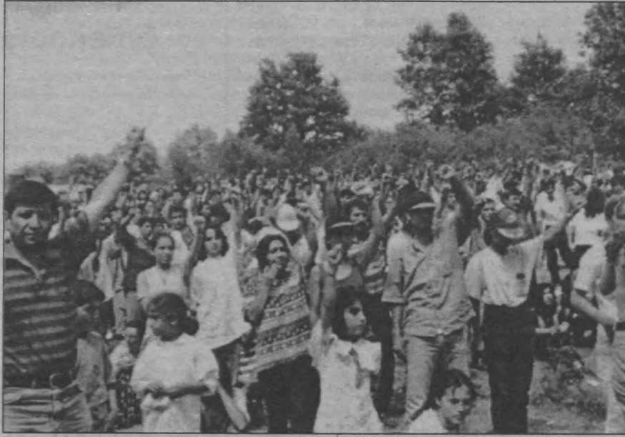
Binlerce partizan kendi sesleri, kulakları, gözleri olan Partizan Dergisi'yle dayanışmak ve güçlendirmek amacıyla düzenlenen gezi de doğanın yeşilliklerinde birbirlerini kucakladılar.

Çok özel, çok ayrı bir önemi vardı bu gezinin aynı zamanda. Proletarya Partisi'nin gerçekleştirmiş olduğu 2. OPK büyük bir sevinç ve coşkuyla selamlandı, kutlandı. Sloganlar "OPK'ya Selam, Savaş Devam!", "Yaşasın 2. OPK'mız!" şeklindeyken geziye katılmayan fakat, ruhlarıyla, kavgalarıyla, ideolojileriyle, özlere ve düşleriyle oradaki insanlarla bütünleşmiş, tek bir yürek olmuş insanların mesajları büyük bir dikkat ve ilgiyle dinlendi. Sağmalcılar Cezaevi TKP/ML utsakları adına yollanan mesajda, Partinin 2. OPK'sının sol ve sağ tasfiyeciliği mahkum ederek Maoist güzergahta başarıyla sonuçlandırıldığına dikkat çekildi. Kızıl gençlik örgütü TMLGB-MK'sı tarafından gönderilen mesajda ise günün artık kirliliği atıp temiz giymenin, 2. OPK'da alınan kararlar doğrultusunda partiyi güçlendirmenin, savaşı ilerletmenin zamanı olduğu belirtilerek insanlarımız kavgaya ve proletar-