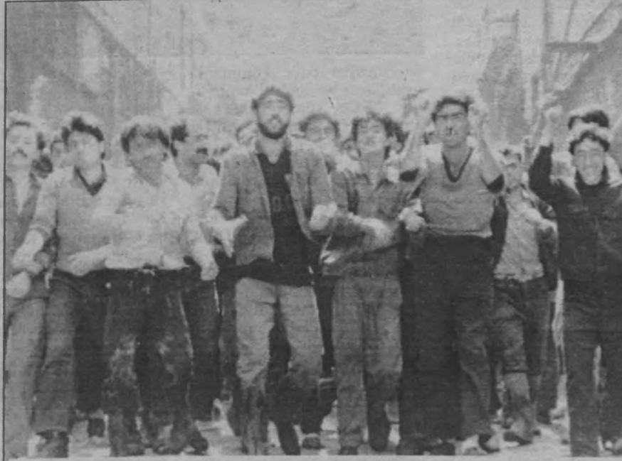
8 Eylül'de tarım işkolunda başlayan grev giderek yayılıyor. Metal iş kolunda, köy hizmetleri, karayolları alanlarında, şeker fabrikalarında yaygınlaşan grev ay sonuna doğru 500 bin kamu işçisini kapsayacak. Üstelik de "Doğu ve Güney Doğu anadolu" da "güvenlik" gerekçesiyle grevler ertelenmesine rağmen. Faşizmin kendi yasalarına bile uymamasını T. Kürdistanı'nda ayrı bir yasal prosedür uygulamasında görüyoruz.

Bu kan dolu tekere çomak sokmanın zamanı çoktan gelmiştir. Ancak belirtmek gerekiyor ki; devrimci ve komünistlerin yetersizliği onlara bu oyunları oynama fırsatını veren önemli bir etkidir. Bunun iyice görülmesi ve gereğinin yapılması, he-sabının sorulması gerekiyor. Bu hesap soruculuğun, dağların hesap soruculuğuyla birleştirilmesi ise olmazsa olmaz bir gerekliliktir. ■