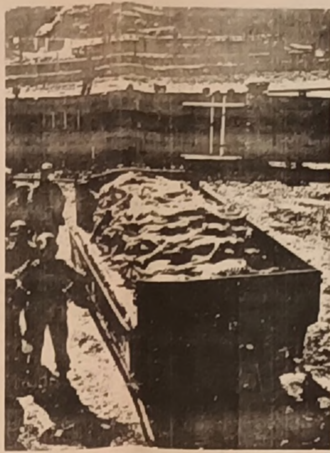
Hitler'in Temerküz kamplarından insan cesetleri işte böyle taşınıyordu!

Ayrıca Alman faşistlerinin başını çektiği ve üçlü faşist mihrak (Almanya-İtalya-Japonya) başlattığı 2. Dünya Savaşı boyunca, tam 40 milyon insan öldürüldü, yüz milyonlarca insan yaralandı, sakatlandı, evsiz bırakıldı!