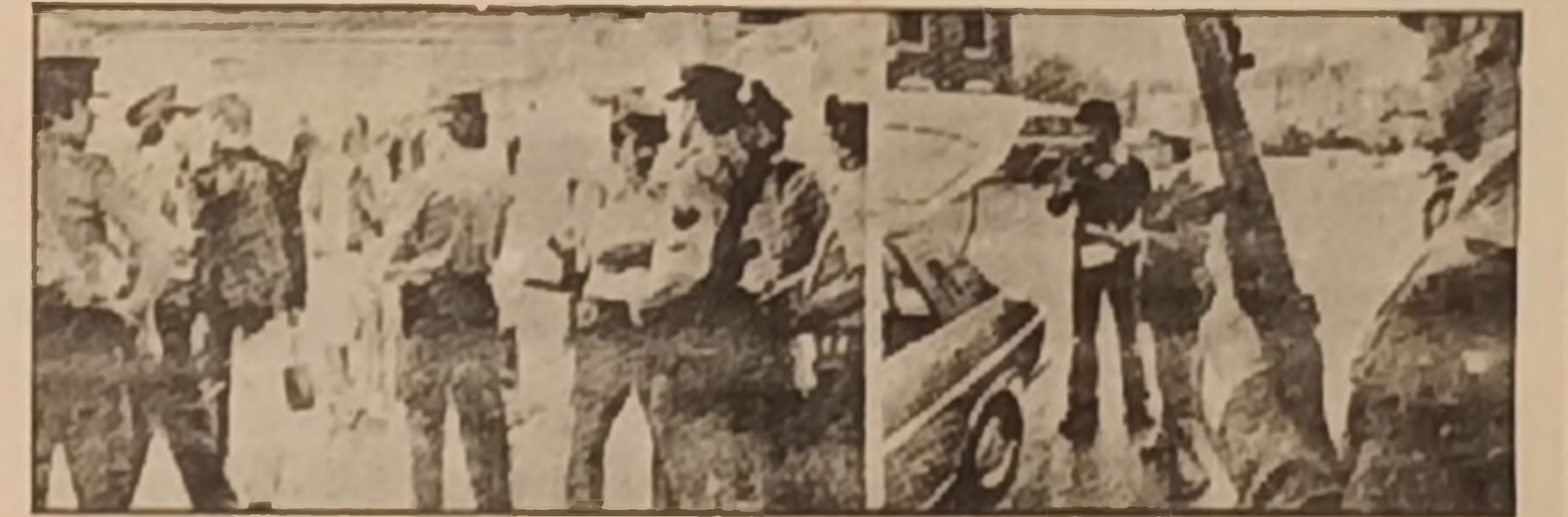
Bir "polis devleti" olma yolunda hızla ilerleyen Almanya'da "tedhişçi" yahalama bahanesiyle suçun arama taramalar yapıyor. Devrimcilerle ilgili bilgiler elektronik beyinlerle değerlendiriliyor. Anıların fotoğrafları televizyonlarda gösteriliyor, halha dağıtılıyor. Denizde sahil horuma botları, stratejik kaçak ve havaalanlarında otomatik silahlı "güvenlik" hususları sürekli olarak devriye geziyor.