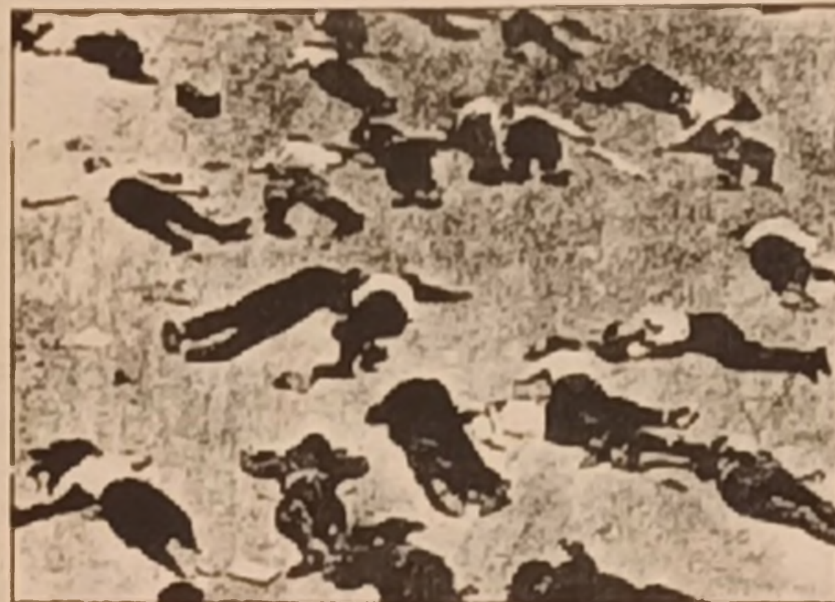
Katil Franko'nun tertiplediği bir katliam örneği!