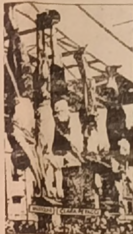
İspanya kopeğinin sonu böyle oldu!

Dikemizi faşistler de, sonlarının mutlaka böyle olacağından hiç kuşku duymasınlar! Halkımız, tüm faşist katillerden, yaptıklarının hesabını tek tek mutlaka sofacaktır! FAŞİZM DOĞTUĞU KANDA BOĞULACAKTIR!