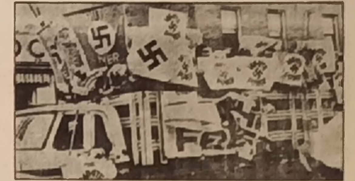
Amerika'da Naziler "Beşiz İktidarı" diye gösteriler yapıyorlar!

Batı Alman tekelci sermayesi ise her türlü devrimci