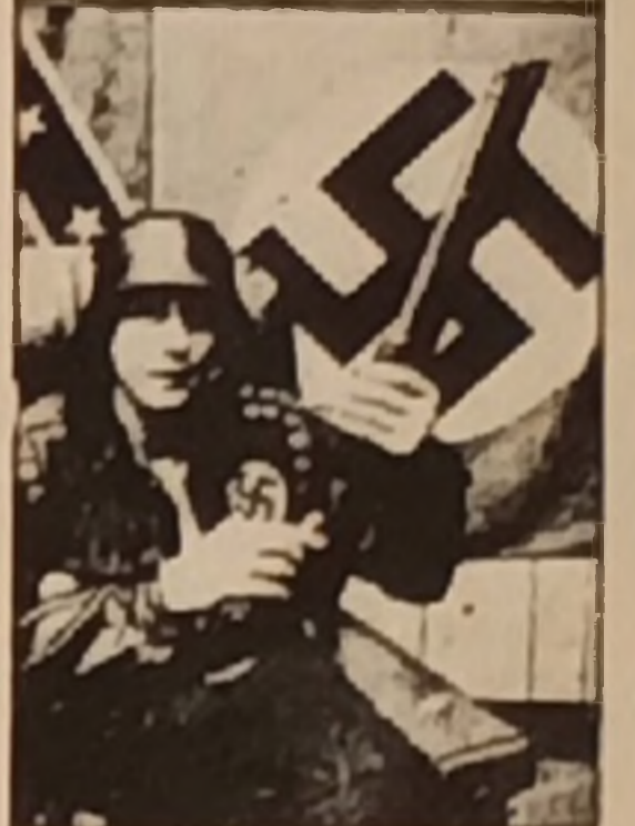
Amerika'da kurulan "Yeni Nazi Grubu" sesini duyurmaya başladı!

Bütün bunlar, çöküşe giden emperyalist burjuvazinin çarpışmalarıdır. Fakat emperyalizmin kaçınılmaz nihai sonunu, ne faşizmin hortlatılması ne de polis devleti kurma çabaları engelleyemez. Züfer, uluslararası proletaryanın ve onun önderliğindeki ezilen halkların olacaktır! Emperyalizm, sosyal emperyalizm ve her türlü gericiлик mezara gömülecektir!