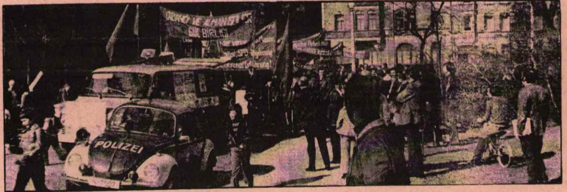
NÜRNBERG'TE İŞSİZLİĞİ, İŞTEN ÇIKARIMLARI PROTESTO EDEN BÜYÜK BİR YÜRÜYÜŞ YAPILDI.

Çok sayıda işçinin iştirak ettiği yürüyüşte, konuşmacılar işsizliğe karşı mücadelede, kapitalist sisteme karşı mücadeleden ayrılmayacağını, bu nedenle yalnızca ekonomik talepler etrafında birleşmenin yeterli olmadığını, siyasi olarak güçlenip kapitalist sistemin ortadan kaldırılması yolunda mücadelenin esas olduğunu söylemişlerdir.