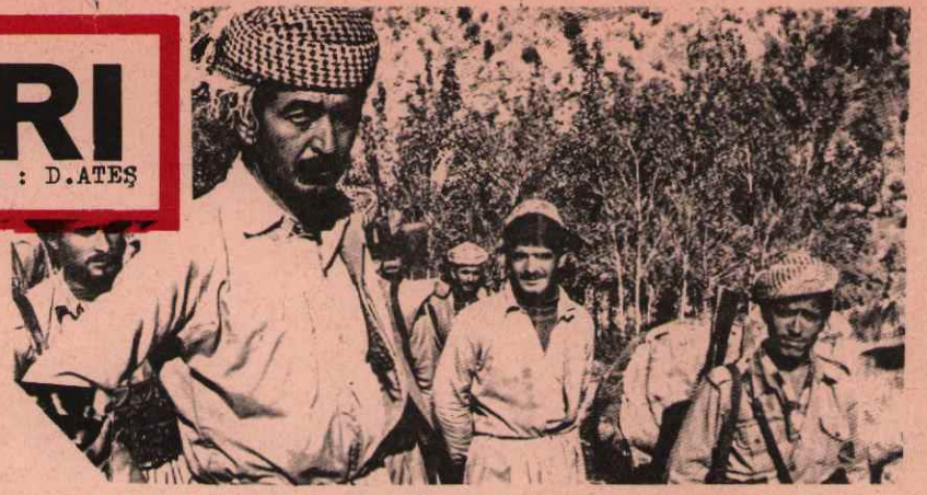
ZAFER KÜRT HALKININ OLACAKTIR.

Geçen ay içinde Irak'taki Kürt milli hareketi, Irak hükümet kuvvetlerinin geniş bir saldırısıyla karşılaştı.