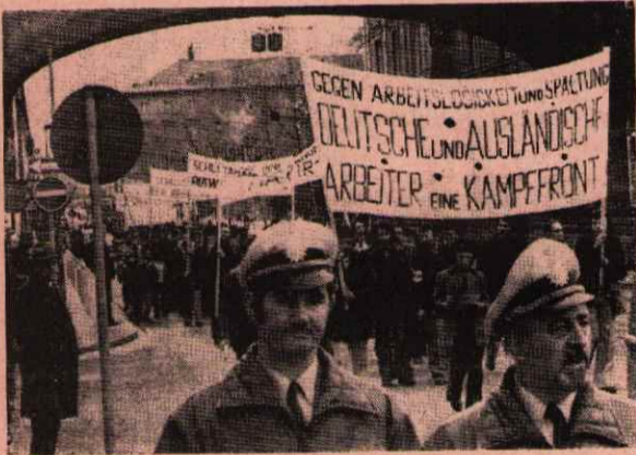
DARMSTADT'TA İŞÇİLER YÜRÜYÜŞ YAPILAR

İşsizliğin gelişmesi karşısında, ilerici birlemler çeşitli protesto hareketlerini yoğunlaştırmışlardır.