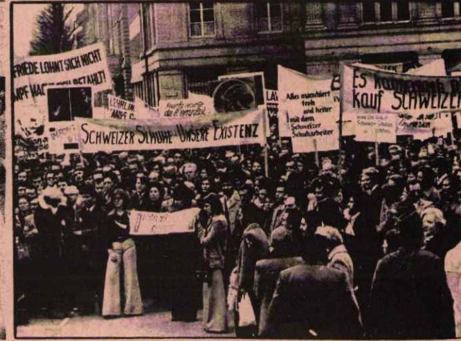
AVRUPA'NIN EN KÜÇÜK ANCAK DÜNYANIN SAYILI ZENGİN ÖLKELERİNDEN KABUL EDİLEN İSVİÇRE'DE İŞÇİ ÇIKARIMLARINI PROTESTO İÇİN YAPILAN MİTING

Aachen ve Çevresi Türkiyeli İşçiler Derneğinin de katıldığı bu yürüyüşte : İşsizliğin neden olduğunu, işsizliğin bulunmadığı bir düzenin olabileceğini, ancak böyle bir düzenin kapitalist sistemin yıkılmasıyla kurulabileceğini açıklayan bir çok işçi Alman patronlarının tutumlarına protesto etmişlerdir.