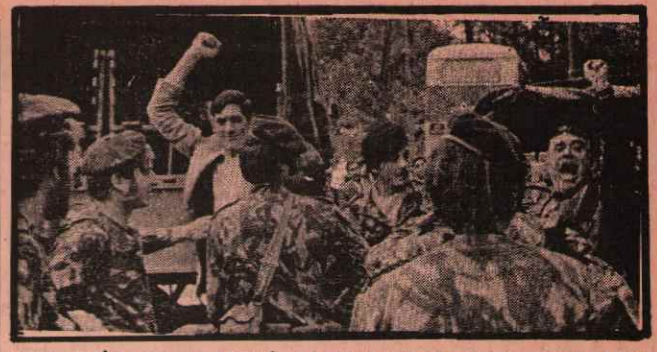
PORTEKİZ'DE DARBECİ ORDU TARAFINDAN TUTUKLANAN İŞÇİ-KÖYLÜ BİRLİĞİ ADLI TEŞKİLAT ÜYESİ 2 DEVRİMCİ

Yeni habes rejimi, tıpkı kendinin devirdiği Halie Selasiye rejimi gibi, eritre halkının mücadelesini kan ve ateşle bastırmaya çalışıyor. Ama bu boşa çabadır. Yıllardan beri silah elde bağımsızlık mücadelesi veren Eritre halkı, bu baskılardan yılmıyor. Zafer Eritre halkının olacaktır.