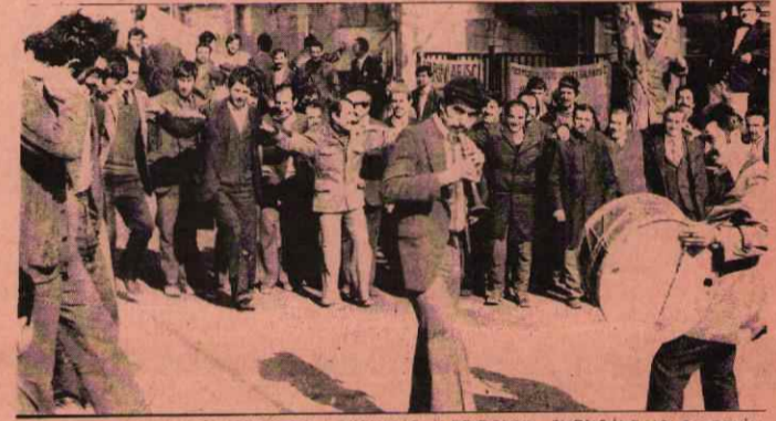
İTMO METAL FABRİKASI KAPISINDAKİ GREVCI İŞÇİLER DAVUL-ZURNA İLE HALAY ÇEKİYOR

Sosyal-İş Sendikasına bağlı işçiler, işverenin toplu pazarlık görüşmelerine katılmadığını, işçilerin tüm haklarını çiğnediğini ve işverenin baskısına karşı gelenlerin işten atılmak istendiğini ileri sürerek, sendikadan aldığı grev kararına tüm güçleriyle iştirak etmişlerdir.