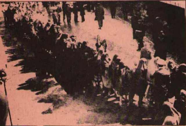
Sivas'ta şeker kuyruğu trafiği aksattı