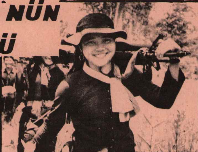
KADIN VIETKONG SAVAŞÇILARI KADININ KURTULUŞU ANCAK DEVRİMLE GERÇEKLEŞEBİLİR

Kurtarılmış bölgelerde halkın demokratik iktidarı geliştirilirken, emperyalizm hala işgali altında bulunan bölgeler de kurtarılmaya çalışılıyor. Mart ayı içinde vietkong savaşçıları Tiyö'nün işgali altında olan bölgeleri kurtarmak için genel taarruza geçti. Bu saldırıda 1 Nisan kadar emperyalistlerin ve uşaklarının elinde bulunan 6 şehir daha kurtarıldı. Kurtarılan şehirlerin içinde stratejik öneme sahip Da-Nang da var. Bilindiği gibi bu şehir, Tiyö rejiminin elindeki en önemli liman şehirlerinden biriydi.