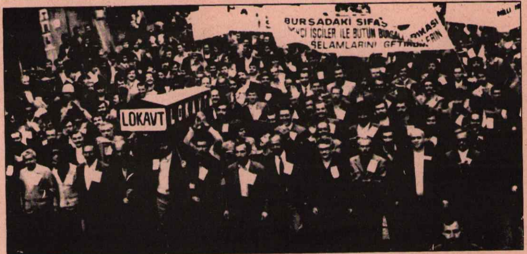
Türk-İş ve Tekiş tarafından düzenlenen yürüyüşe binlerce işçi katıldı. İşçiler pahalılığı protesto ederken, "Lokavt" adını verdikleri siyah bir tabutu da şehir içinde eller üzerinde taşıdılar ve daha sonra bütün milletin gözü önünde yakarak denize attılar.

İşçiler "Biletleri sattılar, paraları tahsil ettiler, bugün bizi yurda götüreceklerine dair söz verdiler ve sonunda hepimizi alanda bıraktılar" diyerek THY'dan davacı olduklarını belirtmişlerdir.