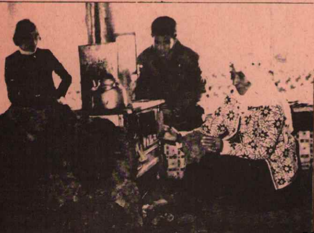
Pülümür'de tezeğin kilosu 3 liraya yükseldi