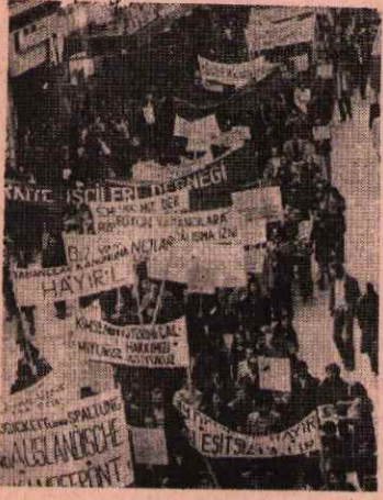
DORTMUND'DA YAPILAN YÜRÜYÜŞE ALMANYA'DA KI DERNEKLER VE DORTMUND'LU İŞÇİLER KATILDI

1 Şubat 1975 günü Dortmund'da yapılan yürüyüşe Almanya'nın çeşitli yörelerinden gelen dernekler katılmışlardır. Dortmund'da çalışan işçilerinde yürüyüşe iştirak etmeleriyle çok büyük bir kalabalık Alman Patronlarının Almanya'da ki işçilere uyguladıkları ekonomik ve siyasi baskıları protesto etmişlerdir.