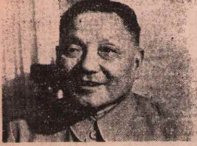
TENG HSIAO PING YENİDEN GÖREVLERİNE GETİRİLDİ.

Çin Halk Cumhuriyetinde geçen ay içinde önemli siyasi gelişmeler oldu. Bu gelişmelerin en önemlisi, Çin Komünist Partisi X. Merkez Komitesinin 16-21 tarihleri arasında yaptığı toplantı idi. Bu toplantıda, Çin Komünist Partisi Merkez Komitesi, 1976 yılı Nisanında bütün görevlerinden uzaklaştırılan Teng Hsiao Ping'i yeniden görevlerine getirme kararı aldı.