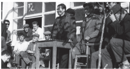
50. YILINDA KAYPAKKAYA'NIN ÖLÜMSÜZ ANISINA

Komünist önderin mezar başındaki anma ezgi ve marşlarla sona erdi.