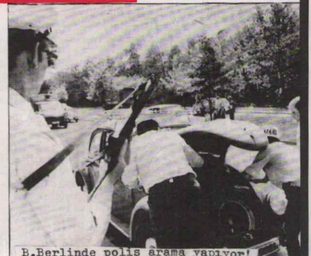
B.Berlinde polis arama yapıyor!

Bulgar devleti bir yandan, bir devletin diğer bir devletin iç işlerine karışmama ilkesinden, bağımsızlıktan dem vururken, diğer yandan da, B.Alman polislerinin Bulgaristan'da devrimci avına çıkmasına izin verip yardımcı olmaktadır. Bu da bize Bulgaristan'ın sadece lafta sosyalist ve bağımsız olduğunu, gerçekte ise, sosyal faşist bir ülke olduğunu bir kez daha ispatlamaktadır.