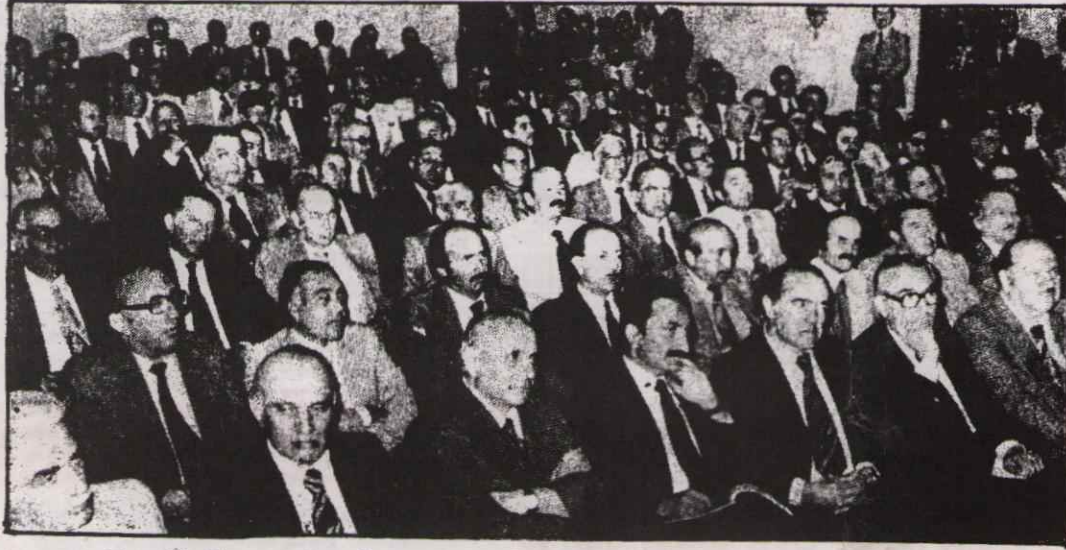
Ecevit Komprador-Patron ve Toprak Ağaları ile Birlikte!

"Türkiye'nin artık 70 cente ihtiyacı yoktur. Yoğun çabalarımız sayesinde geçen beş aylık dönem içinde, 5 Milyar dolarlık ödeme kolaylığı sağlanmış, içinde bulunulan döviz dar boğazından çıkılmıştır."