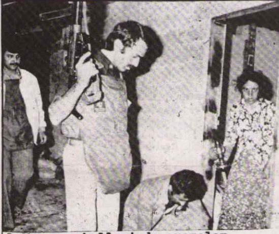
1 Mayıs mahallesinde aramalar Ecevit hükümetinin 'özgürlük' anlayışı

ve tekellerden eski borçları ödeyebilmek için yeni borç ve kredi dilenmek oldu.Emperyalist devlet ve tekeller,Türkiye'ye yeni kredi açma şartlarını Uluslararası Para Fonu (IMF) denilen Amerikan emperyalizminin denetimindeki kurum aracılığı ile bildirdiler.IMF,Türkiye'den TL'nin değerinin % 30 civarında düşürülmesini;ücretlerin dondurulmasını ve buna benzer bir dizi talepte bulundu. 'Emperyalizme karşı'olduğunu programında ilan eden hükümet,IMF'nin taleplerinin ilkinin hemen uygulamaya koydu.TL'nin değerinde % 37 yi bulan iki devalüasyon yapıldı. IMF'nin diğer talepleri için ise, IMF e bir 'iyi niyet' mektubu verildi.