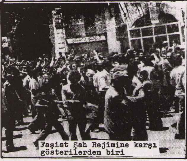
Faşist Şah Rejimine karşı gösterilerden biri