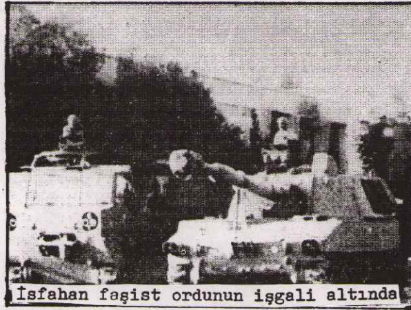
İsfahan faşist ordunun işgali altında

İşte bunlardır, İran halkını mücadeleye sevk eden etmenler. İran halkı, haklı talepler uğruna haklı bir mücadele vermektedir. İran halkı, ergeç faşist şah rejimini devirip, bağımsız ve demokratik bir İran'ı kuracaktır. Tüm devrimcilerin ve demokratların görevi, İran halkının mücadelesini desteklemektir.