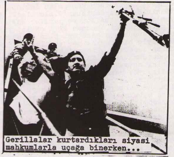
Gerillalar kurtardıkları siyasi mahkumlarla uçağa binerken...

Bir Orta Amerika ülkesi olan Nikaragua'da işçileri ve maliye bakanlıklarının, parlamentonun bulunduğu Milli Saray, Nikaragua Kurtuluş Cephesi gerillalarının basıldı. Baskın sırasında Milli Sarayda bulunan binden fazla kişi rehin alındı. Gerillalar daha sonra bakanlar ve milletvekillerinden oluşan 40 kişinin dışında kalanları serbest bıraktılar. Hükümet kuvvetleri, ilk önce sarayı kuşatıp, gerillaların elindeki siyasetçileri kurtarmak istedikler. Fakat hükümet kuvvetlerinin bu girişimi başarısızlıkla sonuçlandı. Daha sonra hükümet, gerillaların isteklerini kabul etmek zorunda kaldı. İlk önce gerillaların bir saatlik açıklaması, ülkenin tüm yayın istasyonlarına yayımlandı. Daha sonra faşist diktatörlüğün hapishanelerinde tutuklu bulunan siyasi mahkumlar serbest bırakıldı ve ayrıca gerillaların isteği 500 bin dolar verildi. Gerillalar da rehinelere serbest bıraktılar. Daha sonra Gerillalar, 59 siyasi tutukluyu da yanlarına alarak Venezuela'ya gittiler. Halk, gerillaları alkışlarla uğurladı. Gerilla hareketinin başarıyla sonuçlanması, Nikaragua halkını sevinçe boğdu. Halk sokaklarda 'Kahrolsun Somoza' ve 'Yaşasın Sandinitas' diye haykırdı. Daha sonra ülkede genel grev ilan edildi. Görünen odur ki, Nikaragua da faşist diktatörlük kısa bir süre sonra yıkılacaktır. Zafer, mutlak Nikaragua halkının olacaktır.