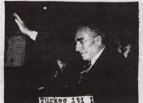
Türkeş iti !

Son günlerde vuku bulan İğdir, Tepecik, Balgat, Tosya, Sivas, ve Örnektepe olaylarının faşist Türkeş'in komandoları ve MHP tarafından yapıldığı resmi belgelerle ispatlanmıştır. Türkeş, eli kanlı komandolarının cinayetleri ortaya çıkınca, cinayetlere karşı çıkar görünmekte ve suçlu