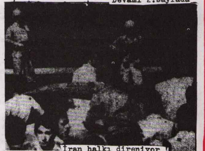
İran halkı direniyor !

Bilindiği gibi ABD emperyalizminin usa- Devamı 2. sayfa