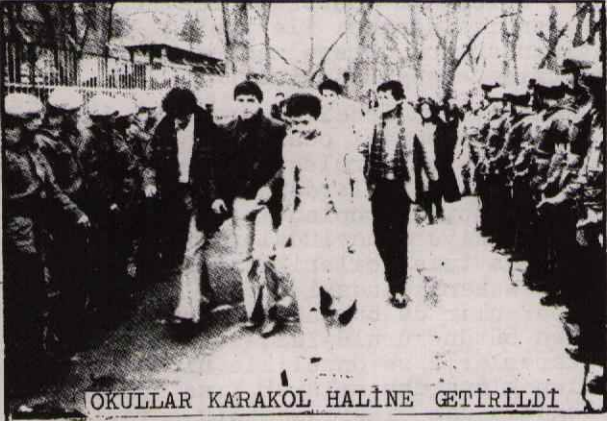
OKULLAR KARAKOL HALİNE GETİRİLDİ

Bu dönem zarfında Türkiye halkı sıkıyönetimin özünde kısıtli olan, zorlu mücadeleler sonucu elde ettiği demokratik hak ve özgürlüğümüzün vahşi saldırılarla, açık faşist uygulamalar ile nasıl ortadan kaldırıldığını berrak bir şekilde gördü.