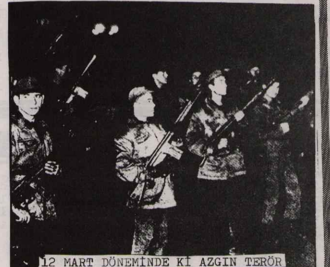
12 MART DÖNEMİNDE Kİ AZGIN TERÖR

Özellikle 1960 ların sonlarına doğru halkımızın çeşitli sınıf ve tabakalarının ilk önce ekonomik talepler temelinde gelişen mücadelesi, kısa zamanda semiyasi bir nitelik kazanarak komprador patron-ağa devletini tehdit eder duruma gelmişti. Kendiliğinden gelişen işçi sınıfı hareket-