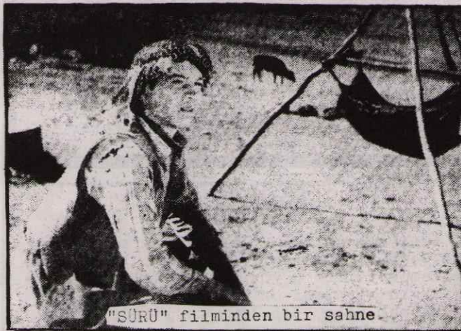
"SÜRÜ" filminden bir sahne