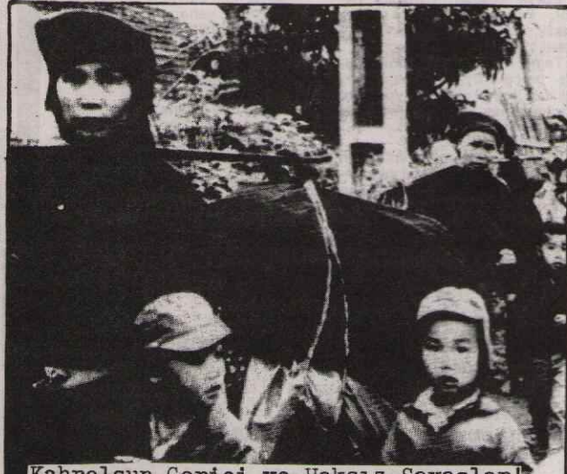
Kahrolsun Gerici ve Haksız Savaşlar!

Vietnam'ın Kamboçya'ya işgali ve ardından Çin'in Vietnam'a bir "ders vermek" amacıyla saldırması sonucunda ortaya çıkan durum, bütün dünyada geniş tartışmalara yol açtı. Lenin'in de dediği "boş, sonuç olmayan tartışmalara... Çünkü gerçek devrimciler dışında herkes meseleye, sa-