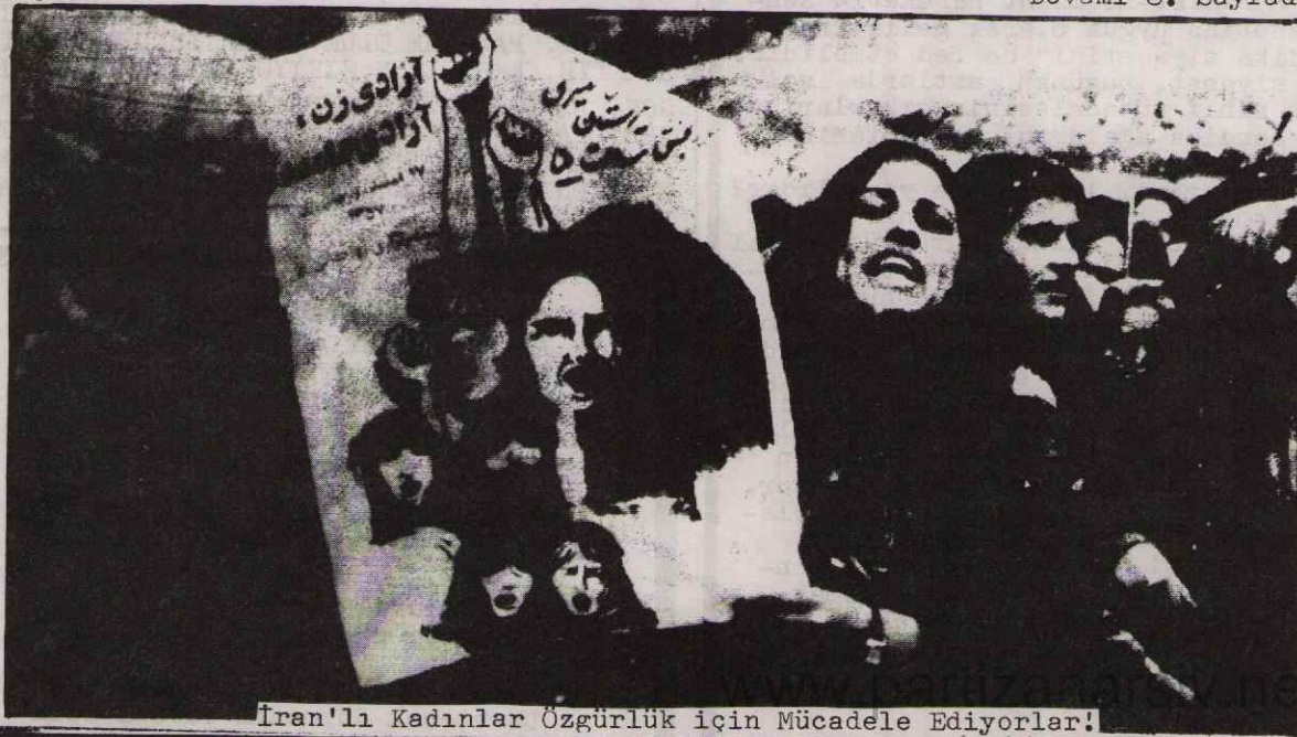
İran'lı Kadınlar Özgürlük için Mücadele Ediyorlar!