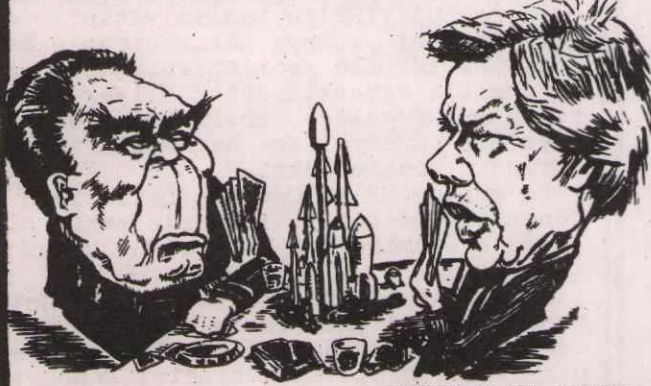
BREJNEV VE CARTER

lararası rokete sahipken, bu sayı Salt II "sınırlandırması" ile 820'ye çıkarıl- dı. Yine çok başlıklı roket denizaltısın- dan 496 tane ABD ve 96 tane de Rusya sa- hip iken, bu sayı da 380 olarak belirlen- di. Roket atar bombardıman uçaklarına ne ABD ne de Rusya sahip iken, bu tür uçak- ların yapımı ve 120 taneye kadar da bu- lundurulması ön görülmüştür. Her iki dev- letin sahip olduğu bugünkü standartlar ve Salt II ile belirlenen sayılar yan yana bulunduğu Salt II'nin hiç de bir sınırlandırma olmadığı göze çarpmaktadır. Bunun yanında bu ülkelerin savunma bütçe- lerine bakıldığında, Salt II ile savunma bütçelerinin son durumu uyarılılık içinde- dir. Amerikan emperyalistleri savunma büt- çelerini bu yıl 11 milyar dolar arttırmış- lardır ki, Carter'in verdiği demece göre bu sayı, ABD'nin savunma bütçesinin % 10'u dur. Rusya'nın savunma bütçesi kesin olarak bilinmemesine rağmen, Carter'in e- leştirilerinden Rusya'nın da savunma gi- derlerini arttırdığı anlaşılmaktadır.