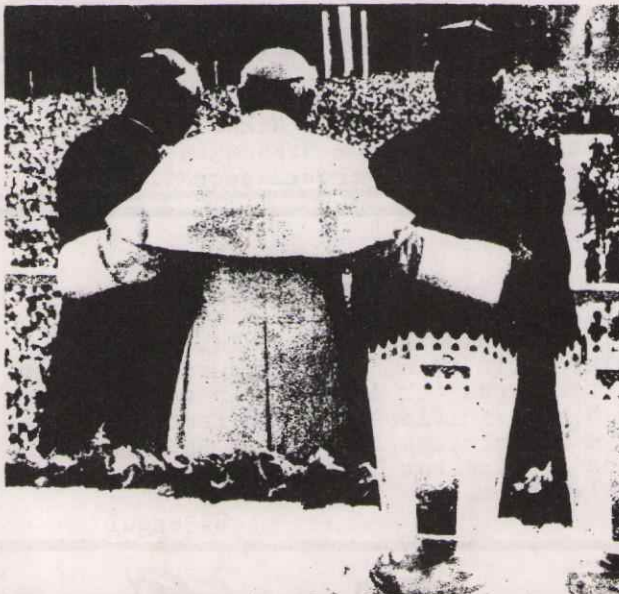
Polonya'da revizyonist ideolojinin iflası

Batılı emperyalistler, basın-yayın or- ganları aracılığı ile, Papa'nın Polonya gezisinin "dinin ve insanlığın" Marksizme karşı kazandığı zafer olduğun- un propogandasını yaptılar.