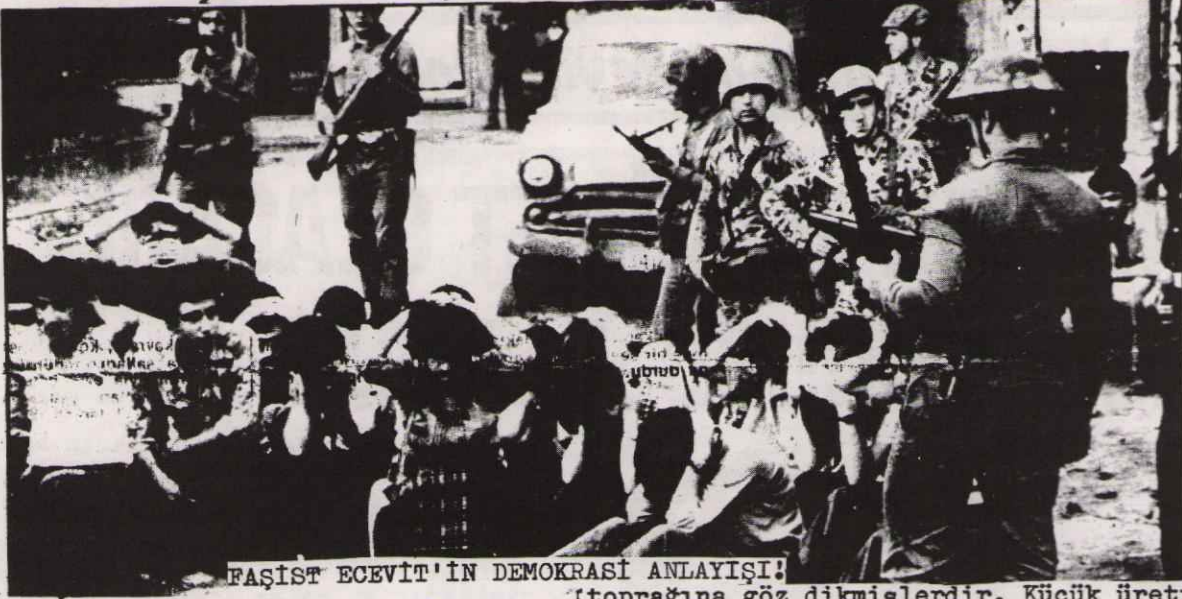
FAŞİST ECEVİT'İN DEMOKRASİ ANLAYIŞI!

"Anayasa'nın 123. maddesinde sözü edilen olağanüstü haller, İçişleri Bakanlığınca açıklanmış ve bir olağanüstü haller yasası tasarısı hazırlanarak tüm Bakanlıkların görüşüne sunulmuştur."