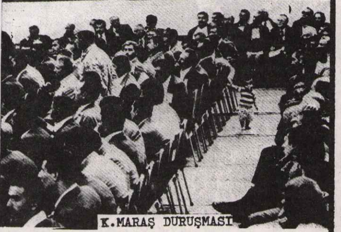
K. MARAŞ DURUŞMASI