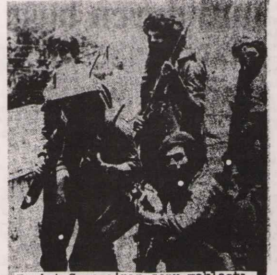
Faşist Somoza'nın sonu yaklaştı.

ABD emperyalizminin uşağı faşist Somoza- nın sonu görüldü. 42 seneden beri Nikara- gua halkına kan kusturan, faşist Somoza ai- lesinin temelleri şu günlerde yıkılıp tari- hin çöplüğüne atılmak üzere yığıt Nikara- gua halkı, faşist Somoza'nın diktatörlüğü- ne son darbeyi indirmek için canla başla savaşıyor.