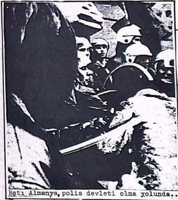
Batı Almanya, polis devleti olma yolunda...

Batı Alman emperyalist tekelleri ve devleti dünyanın bir sürü sömürge, yarı sömürge, yarı feodal ülkesine sermaye ihraç etmekte, ekonomisini esas olarak buralardan yaptığı talana dayandırmaktadır. Yaptığı talanlar sonucu burada sermaye durmadan artmış endüstri ilerlemiş ve kendi ülkesindeki iş gücü sermayeye paralel olarak artmamıştır. Bunun sonucudur ki patronların habis kâr hırsı iş gücü talep etmiştir.