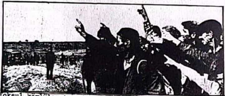
Yoksul köylüler toprak ve hürriyet için mücadele ediyor.