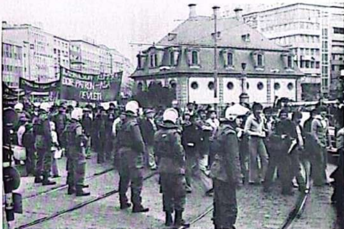
Frankfurt (77) . faşizmi protesto yürüyüşü

Bu mücadelelerimizin başarıya ulaşması için yerli ve yabancı teşkilat ve kişilerle eylem birlikleri ve ortak eylem yaparız. Eylem birliğini; eylemde birlik, propaganda ve ajitasyonda serbestlik ilkesi temelinde yaparız. ATİP'in yaptığı herhangi bir eylemin yönelimini veya hedefini doğru bulan her türlü teşkilat veya fert ATİP'in düzenlediği eyleme katılır, kendi ajitasyon ve propagandasını eylemin hedefini saptırmamak şartıyla yapabilir. Yine biz herhangi bir teşkilatın yaptığı hedefi doğru olan eyleme katılır kendi propaganda ve ajitasyonumuzu yaparız. Eylem birliklerinde biz kendi bloğumuzu eyleme katılan diğer örgütlerden ayırır öyle propaganda ve ajitasyon yaparız.