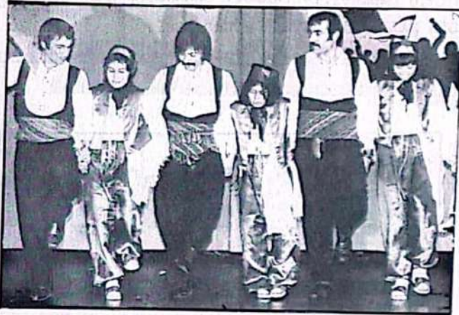
Hamburg ve Çevresi Türkiyeli işçiler Derneğinin folklor gösterisi.

-ATIF grev fonu ve hukuki yardım ve ATIF'e bağış makbuzları bastırılmalı, ATIF üyeleri yoğun bir şekilde bağış toplamalıdır!