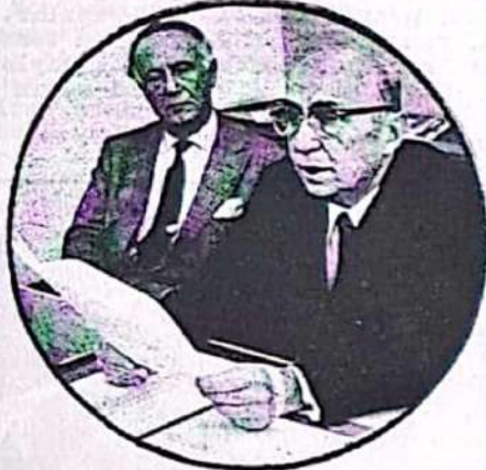
Türkiyenin en büyük kompradorlarından N.Eczacıbaşı ve V.Koç