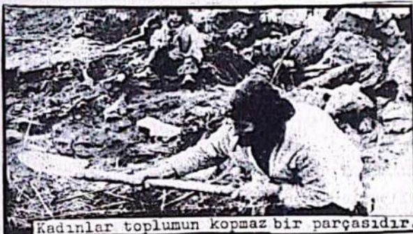
Kadınlar toplumun kopmaz bir parçasıdır.

Ülkemizde çeşitli din ve mezhepler vardır. Hakim sınıfı bu din ve mezhep ayrımını körüklemekle halkımızın birliğini bölmeyi amaçlamaktadırlar. Alevi, Caferi vs. mezheplerine ve müslüman olmayan diğer dinlere mensup olan veya dini inancı olmayan emekçiler aşağılanmakta ve inançlarından dolayı horlanmaktadır.