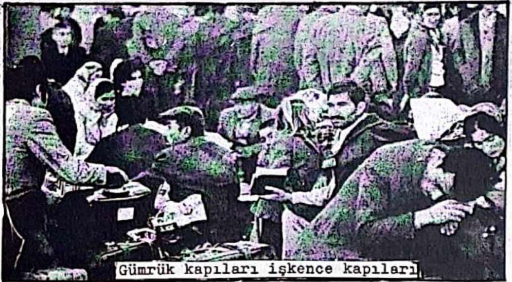
Gümrük kapıları işkence kapıları

-İşçilerin gerek ev, zati ve hediyelik eşyalarından, gerekse Türkiye'de geçimini sağlamak için götürmek istediği araç ve gereçlerden kayıtsız şartsız gümrük vergisi alınmamalıdır.