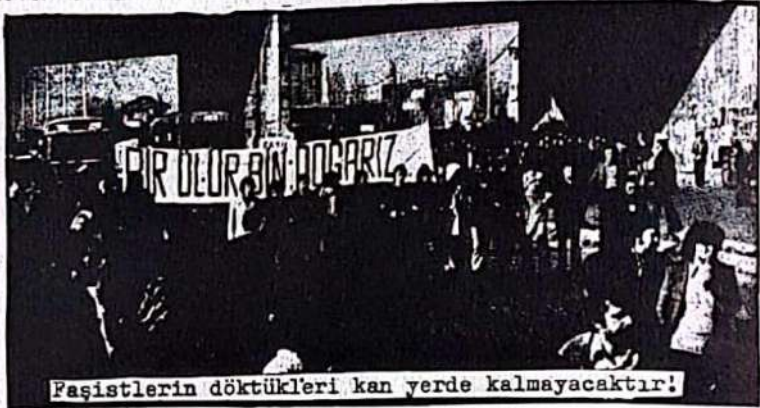
Faşistlerin döktükleri kan yerde kalmayacaktır!

Komprador Patron-Ağa devleti, okullarda kendi siyaseti doğrultusunda eğitim sistemi uygulamakta, kendi menfaatlerine uygun olarak okulları faşist komando sürüleriyle doldurmaktadır. İlerici öğrenciler, gerek okullarda ve gerekse yurtlarda rahat bırakılmamakta onların okumasına müsaade edilmemektedir. Faşist komando sürüleri okulları işgal altında tutmakta, ilerici öğretmen ve öğrencilere saldırmakta; onları sokak ortasında kurşunlamaktadırlar. İlerici öğrencilerin kendilerini savunmalarına bile müsaade edilmemekte, okula giriş ve çıkışlarda faşist komando sürüleri ellerini kollarını sallıyarak gezerken, ilerici öğrenciler polis ve jandarma tarafından sıkı aramalara tabi olmakta, dipçik ve jop altında öğrenim yapmaktadırlar. Gerçekten öğrenim yapamamaktadırlar. Yüksek okulların önemli bir bölümü kapalıdır.