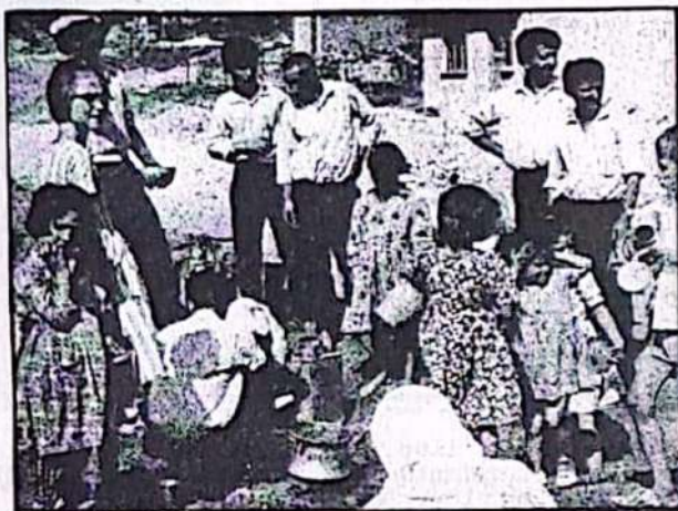
Emekçilerin çoğu yaşamaya elverişsiz gecekondularda oturmaktadırlar.

Sigortaları yoktur. Sigortalı olanlar, sigorta kurumlarından yeterince faydalanamamaktadırlar. Sigorta hastahanelerinde iyi musyene edilmemekte, rüşvet vermek zorunda bırakılmaktadırlar. Çoğu zaman çoluk çocukları ve kendileri hastahane kapılarında can vermektendirler. Emekli maaşları çok düşüktür. Çoğunluğu gecekondular mahallelerinde türlü hastalık mikroplarının barındığı pislikler içerisinde ikâmet etmektedirler. Doğru dürüst yolları, suları ve elektrikleri yoktur. İş yerlerinde çeşitli iş kazalarıyla karşı karşıya çalışmaktadırlar. İş kazalarına karşı gerekli tedbir alınmadığından oldukça yoğun iş kazaları olmaktadır. Grev hakkı kısıtlıdır. Hemen her grev lokavtla karşılanmaktadır. İşsizler ordusu işçi ücretlerini düşürmek için; işçilerin yaşama şartlarını daha da kötüleştirmek için, işçilerin mücadelesini bastırmak için tehdit aracı olarak kullanılmaktadır.