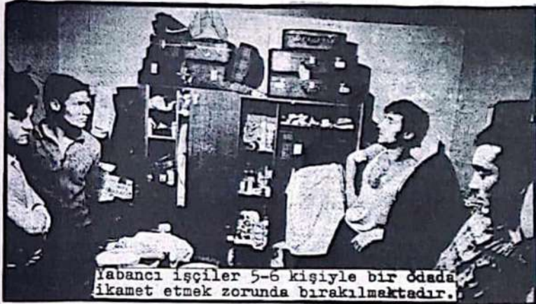
Yabancı işçiler 5-6 kişiyle bir odada ikamet etmek zorunda bırakılmaktadır.

İşçi silelerine çalışma müsadese almak başlı başına bir problemdir. Mevcut duruma göre 1974 Aralığından önce gelenlere otel, restaurant, mutfak, ve temizlik işlerinde binbir güçlülükle çalışma müsadese verilmekte; bu işçilerin meslek değiştirmelerine müsadese edilmemektedir. Ayrıca işçi sile ve çocuklarının getirilmesinde zorluklar çıkartılmakta, onlara oturma müsadese verilirken türlü formaliteler ileri sürülmektedir. Böylece yabancı işçilerin sile düzeni dağılmaktadır.