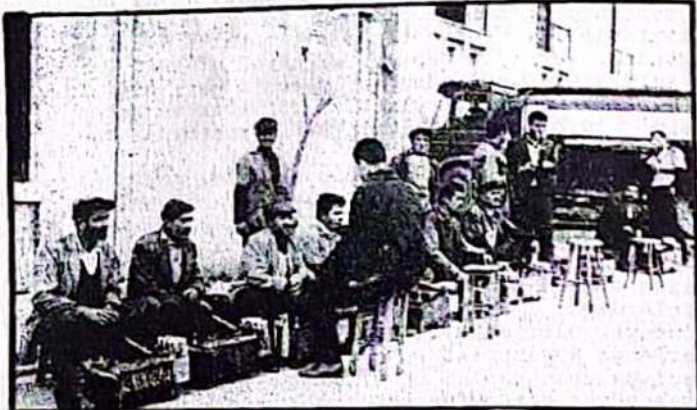
Köyden şehre göçenlerin çoğu ayakkabı boyacılığı gibi örgütsüz işlerde çalışıyorlar.

Böylelikle bir taraftan işsizler ordusu kabarırken; diğer taraftan toprak mülkiyeti belirli ellerde toplanmaktadır.