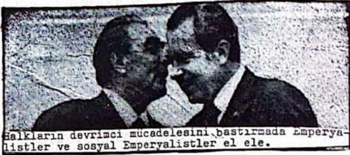
Halkların devrimci mücadelesini bastırmada Emperyalistler ve sosyal Emperyalistler el ele.

Emperyalizm, kapitalizmin son aşamaya vardığı en gelişmiş şeklidir. Sosyal emperyalizm, emperyalizmden nitelik olarak farklıdır. Aradaki fark sosyal emperyalizmin yüzüne sosyalist maske takmasıdır. Bu bakımdan emperyalizm üzerine söylenen her şey sosyal emperyalizm için de geçerlidir.