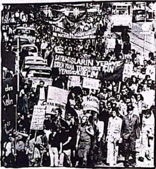
Alman ve yabancı işçiler bir mücadele cephesinde

-ALMAN VE YABANCI İŞÇİLER BİR MÜCADELE CEPHESİNDE BİRLEŞELİM!