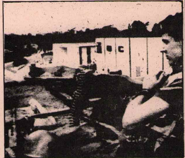
İNGİLİZ EMPERYALİSTLERİNİN DENETİMİNDE YAPILAN DEMOKRATİK(!) SEÇİM

Marksizm üzerine : Marksizmden kaçmadığımız belli ilkeler vardır. Fakat diğer ilkeleri kendimizin geleneklerinden, vs. çıkarırız.