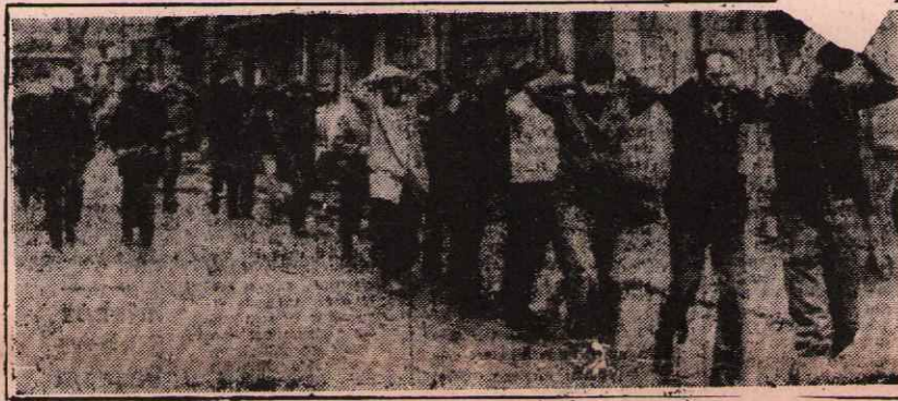
FAŞİST SALDIRILAR MÜCADELEMİZİ DURDURAMAYACAK

"Arkadaşlar, birlikte mücadeleli, zafer günlerini yaklaşıyor. Direnişin başından beri bir yumruk, bir yürek gidevami 2. sayfa