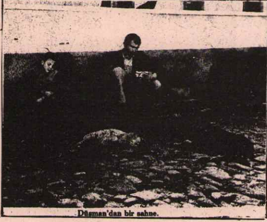
Düşman'dan bir sahne.

30. Uluslararası film festivali geçen ay içinde Batı Berlin'de yapıldı.