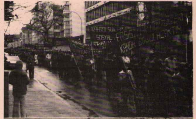
HIÇ BİR SALDIRI BİZİ MUCADELEMİZDEN ALIKOYAMAZ

MHP'li faşist cinayet şebekeleri demokratlara, devrimcilere saldırılarına her gün bir yenisini ekliyor. Dortmund'daki bir saldırıyı konu alan bildiriden bir bölüm yayınlıyoruz.