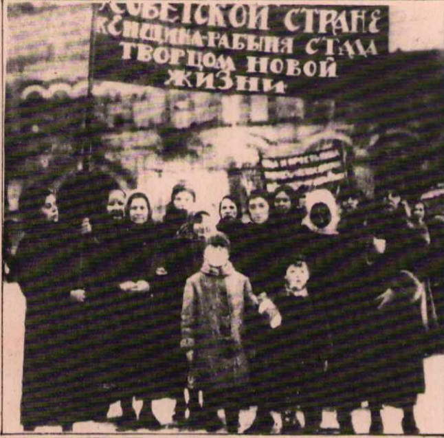
İNSANIN İNSAN TARAFINDAN SOMURULMESİNE SON VERECEK BİR DÜZEN İÇİN...