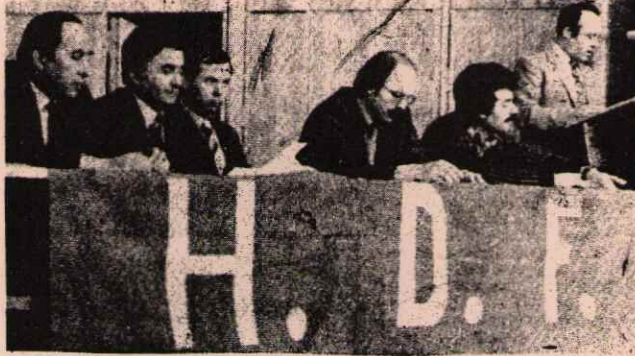
HEM KOMÜNİZME HEM DE FAŞİZME KARŞILARMIS(!)

nin sürekli soru sorması, yuhalaması ve "Kahrolsun komprador patron ağa devleti" sloganını atması, Üstündağ'ı "Biz hem komünizme karşıyız, hem de faşizme karşıyız demeye götürdü. Sorulan soruları "şimdi geleceğim" gibi sözlerle oyalayan Üstündağ "sizin askerlik sorununuza da CHP çözdü" gibi demogojileri de koz olarak kullandı. İşçileri, SPD ve DGB'ye üye olmaya çağırarak bu halk düşmanı ne kadar satılmış olduğunu ispat ediyordu. Efendilerinin teşhir olmasına kızan "HDF" li Batı Alman tekelci burjuvazisinin uşakları da tek tek arkadaşlarımızın fotoğraflarını çekerek ve üzerimize yürüyerek uşaklıkta kusur etmediklerini gösterdiler.