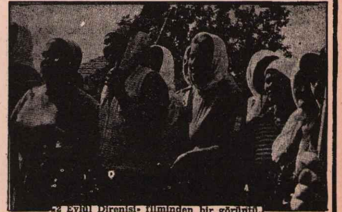
2 Eylül Direnişi filminden bir görüntü.