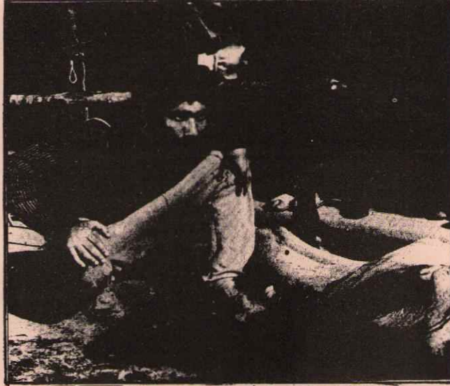
YILMAZ GÜNEY'in "UMUT" ADLI FİLMİN-DEN BİR SAHNE .

Yeşilçam sineması on yıllarca bu gibi komuları kendine temel alarak filmler yapmıştır. Yeşilçam'ın yıllardır süregelen bu değişmez geleneğini yıkmaya çalışan sa