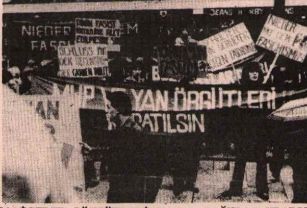
FAŞİSTLER DÖKTÜKLERİ KANDA BOĞULACAKLARDIR

Bunun üzerine Dev-Yol'dan arkadaşlarla ilişkiye geçerek olayın kitleye duyurulması için bir bildiri çıkarılması, avukatlarla ilişkiye geçilmesi önerisinde bulunuldu. Bildiri, Dev-Yol ve ATİF'li arkadaşlar tarafından kaleme alındı. Her iki örgütün imzasıyla birlikte çıkarılması kararlaştırıldı. Ertesi gün arkadaşlar, "Anti-faşist Komite" ile bir toplantının yapılacağına bildirdiler. Biz bu toplantıya katılmadık. Dev-Yol'dan arkadaşlar, "Anti-faşist Komite'nin kararıyla bildiri metninin Türkçesini kısaltarak, bizim imzamızla sorumsuzca kaldırdılar. Altına da sadece "Anti-faşist Komite" yazdılar. Ve aynı gün, Oster tatilinden önce yürüyüş kararı aldılar. Biz bu kararın yanlış olduğunu, yürüyüşün Cumartesi gününe alınması gerektiğini, bildirimsiz tına imzamızın konulması gerektiğini savunduk. Arkadaşlar bizim "Anti-faşist Komite" içinde olduğumuz iddiasıyla bunu yapmadılar. Cumartesi günü yapılan bir başka toplantıda da "Anti-faşist Komite'nin Celalettin Kesim'i "demokrat" ilan etmesi ve bu cümlenin bildiride yer almasını ısrarla savunması sonucu, biz bildiriden çekildik. Ancak eyleme "blok" halinde katılacağımızı, kendi bildirimizi çıkartacağımızı söyledik.