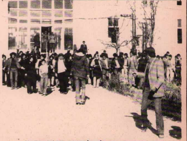
YOZGAT'LI DEVRİMCİLER ADLİYE'NİN ÖNÜNDEKİ DİRENİŞTE

yıldı. Okulun önüne gelen halk, faşist müdür aleyhine sloganlar atarken, güvenlik kuvvetleri halka saldırdı. Faşist müdür kaçarak resmi faşistlerin yanına sığındı. Faşist öğretmenler de dövüldü. Olay yeri ne gelen ilçe Kaymakamı okulun kapanacağını söyledi. Ve okul süresiz öğrenime kapatıldı. Bir süre sonra da Yozgat'tan komando birliklerinin gelmesiyle birlikte, okul tekrar öğrenime açıldı. Faşistler okula gelemeyince, okul tekrar süresiz kapatıldı. Buna öğretmen yetersizliği bakanlık emri, vs. bahaneler uyduruldu. Daha sonraki günlerde jandarma kuvvetleri ilçede geniş operasyonlar düzenleyerek sivil sıkı yönetim uyguladılar. Halk evini ve devrimcilerin gittiği bir kahve vi kapattılar.