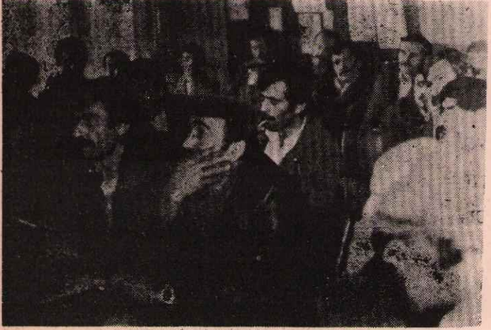
OTOSAN İŞÇİLERİ BİR TOPLANTIDA..

OTOSAN İŞÇİLERİ SARI SENDİKADAN KURTULMAYA KARAR VERDİLER. Bütün sendikaları araştırdılar ve zamanında TUM MADEN-İŞ'i seçtiler. OTOSAN işçileri sendikamızın tüzüğünü okudular, dünya görüşünü öğrendiler. Eylemlerini, toplu sözleşmelerini öğrendiler ve ondan sonra TUM MADEN-İŞ'i seçtiler.