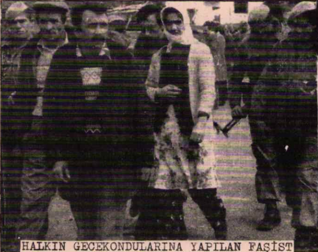
HALKIN GECEKONDULARINA YAPILAN FAŞİST SALDIRILAR CEZASIZ KALMAYACAKTIR !