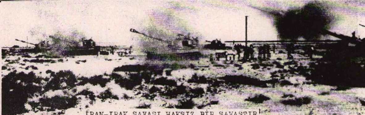
İRAN-İRAK SAVAŞI HAKSIZ BİR SAVAŞTIR!