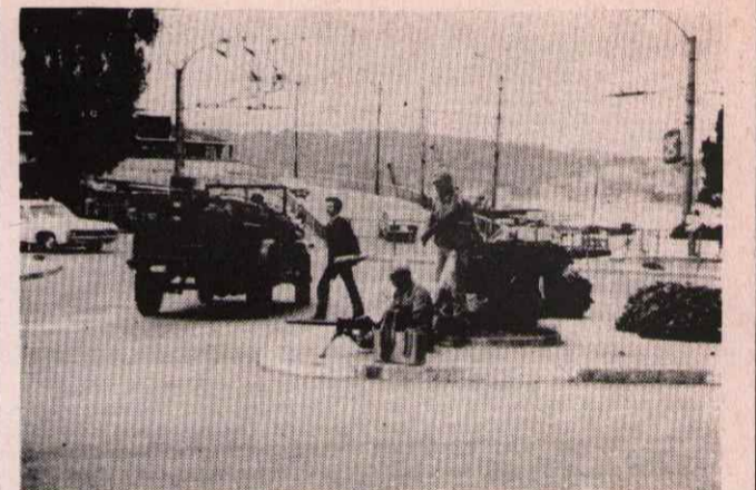
TANKLARINIZ TOPLARINIZ VIZ GELİR BİZE VİZİ

Geçen ay Cunta şefleri bir çok yerde "halkla!" konuşmalar yaptılar. Bu konuşmalarda Cunta şefleri 'sağ ve sol' teröre karşı demagojisi ile halkı uyutmaya; Türk ırkçılığını körüklemeye özel önem gösterdiler. Halktan destek ve zaman istediler.