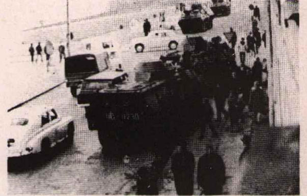
1970 YILINDA GDANSK KENTİNDE GREVDEKİ İŞÇİLER DEVLET GÜÇLERİNE KARŞI DİRENİŞTE...

Ancak bu başarının bir de öbür yanı vardır. O da, bugün bu sendikal hareketin başını çekenlerin batılı emperyalistlerle yakın bağıdır.