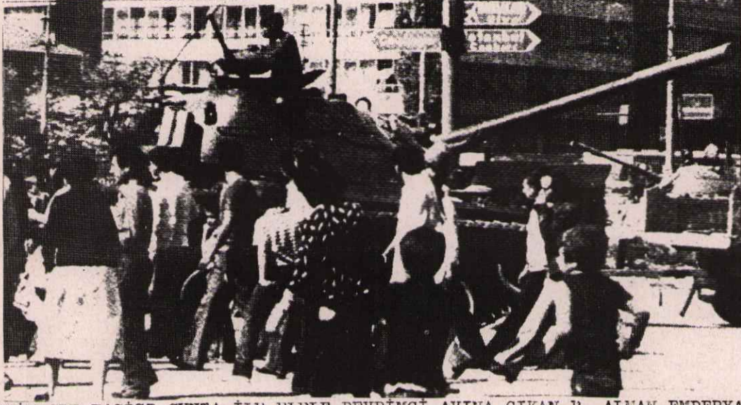
TÜRKİYE'DE FAŞİST CUNTA İLE ELELE DEVRİMCİ AVINA ÇIKAN B. ALMAN EMPERYALİST DEVLETİNİN TÜRK FAŞİST HAKİM SINIFLARINA YAPMIŞ OLDUĞU ASKERİ YARDIMLARLA ALINAN PANZERLER TÜRKİYE HALKINA KARŞI KULLANILMAKTADIR.

Devrimciler B. Alman devletinin bu "militan avı"na karşı uyanık olmalı ve bu devletin niteliğini her yerde teşhir etmelidirler.