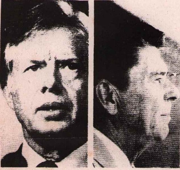
AL BİRİNİ VUR ÖTEKİNE

Amerikan başkanlık seçimleri, büyük yaygaralardan sonra geçtiğimiz ay içinde yapıldı. Seçimlerden önce tüm dünya basını seçimlere büyük yer ayırdı. Ünlü istatistik enstitüleri(!) kim kazanacak diye kamuoyu yoklaması yaptılar. Hatta iş müşterek bahise dönüştü.