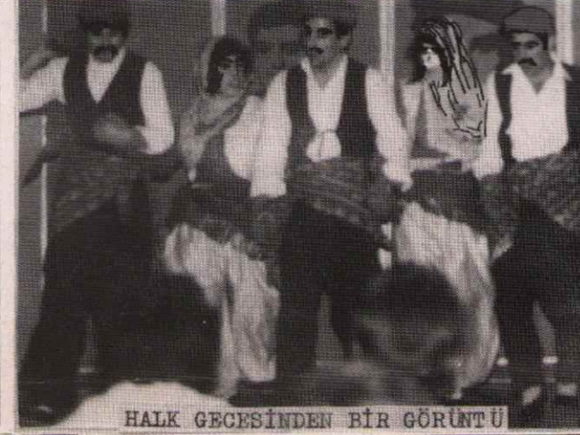
HALK GECESİNDEN BİR GÖRÜNTÜ

22.11.80 de Mainz-Kastel'de halk gece - si yapıldı. Bir kaç şehirde (Wiesbaden, Rüsselsheim, Bad Krennach ve Mainz'de) Fe derasyonumuzun Dernek ve Komitelerinin yo - ğun çalışması sonucu geceye 800 ü aşkın kitle katıldı. Esas olarak olumlu olan ge - cede organizenin kendiliğinden bir şek - le bürünmesi bir olumsuzluktu. Ayrıca kül - türel alanda, saz ve sözle kitlelere yapı lan devrim propagandasında şimdiye kadar tekrarlanan aynı kalıplar içinde kitlele - re hitap etmenin aşılması gerektiği; bu - nun için çaba sarfedilmesi gerektiği tes - bit edildi.