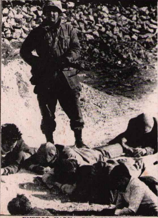
EMEKÇİ HALKA ZULMEDENLER BİR GÜN YOK OLACAKLAR

Emperyalizmin uşağı komprador patronların ve toprak ağalarının cuntası yeni yasal düzenlemelerle, Türkiye'de faşizme 'yasal' bir görünüm vermeye çalışıyor. Cuntanın ilk işlerinden biri hepimizin bildiği gibi, 1961 Anayasasının artıklarını rafa kaldırmak oldu. Bugün Türkiye'de Anayasa 5 kişilik faşist cuntanın kararlarıdır. Bu kararlar 'Anayasa' ile çelişen olursa, geçerli olan cuntanın kararıdır.