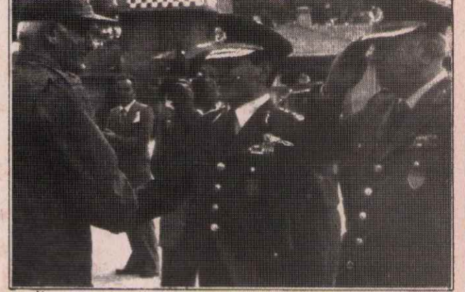
TÜRK FAŞİST GENERALLERİ NATO GENERALLERİ İLE EL ELE

bu Anayasadaki sınırlı demokratik hakları halka kullanılmaması için sürekli olarak faşist terörü yoğunlaştırma yolunu tuttular. Buna karşı yoğunlaştırmalı yetkilerden emekçi halkımız, demokratik haklarını pratikte kullanmak için fedakar, zorlu bir mücadele yürüttü. Ve bu mücadele içinde yer yer önemli başarılar elde etti. Hakim sınıflar bütün bu mücadeleler içinde 1961 de Anayasaya koymak zorunda kaldıkları sınırlı demokratik hakları da Anayasadan çıkarmak için girişimlerde bulundular. 12