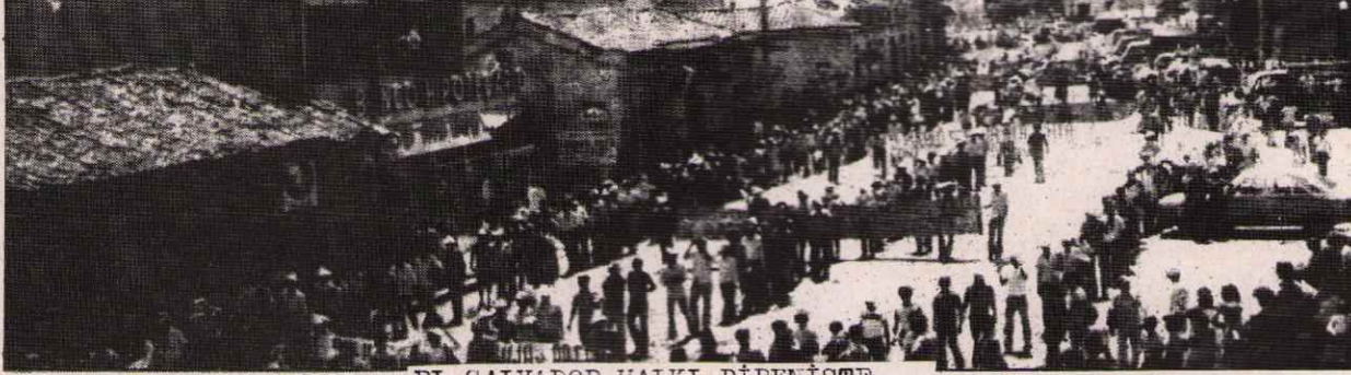
EL SALVADOR HALKI DİRENİŞTE...